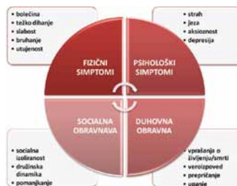
Slika 2. 4D - Paliativen pristop k obravnavi bolnikov z neozdravljivo boleznijo

strokovnjakov različnih strok v PO lahko zagotavlja učinkovito in celostno obravnavo potreb bolnika in njegovih bližnjih (3).