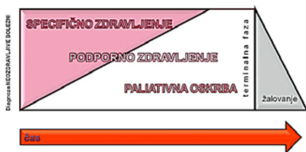
Slika 1. Časovna umestitev paliativne oskrbe v obravnavi onkološkega bolnika z neozdravljivo boleznijo

Glavni namen PO je izboljšati kakovost življenja bolnikov in njihovih bližnjih s pravočasnimi oziroma preventivnimi ukrepi za lajšanje težav: fizičnih, psihičnih, duhovnih in socialnih (slika 2). PO zagovarja življenje in spoštuje umiranje kot naravni proces; smrti ne pospešuje, vendar hkrati tudi ne zavlačuje.