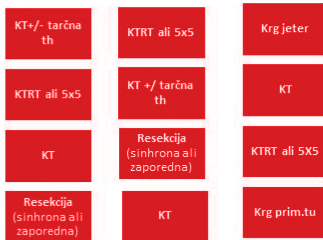
Slika 4: Algoritem možnosti zdravljenja oligometastatskega raka danke

Opomba: Napredovali tumorji danke lahko po presoji konzilija predoperativno prejmejo dolg obsevalni režim. Odlog do operacije po predoperativnem obsevanju je lahko več kot 8–10 tednov.