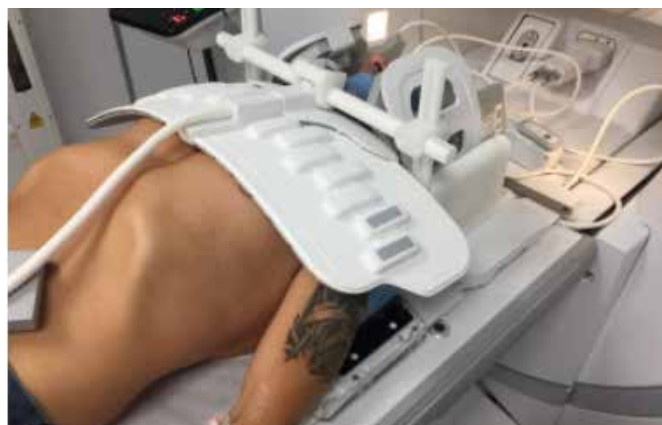
Slika 3: Komplet specifičnih tuljav za radioterapijo (GEM RT Suite) za slikanje področja glave in vratu s termoplastično masko.

Pri MR slikanju za potrebe načrtovanja obsevanja je potrebno zagotoviti ponovljivo nastavitev pacienta z ustreznimi fiksacijskimi pripomočki, kot bo pacient nameščen na obsevalnem aparatu v procesu obsevanja. Zagotoviti želimo identičen položaj pacienta in posledično enako pozicijo organov in tarčnih volumnov, kot je predvideno v obsevalnem načrtu. Pri tem uporabljamo posebne tuljave, katerih namen je prilagoditev obsevalnem položaju in slikanju interesnega področja (slika 2, 3). Značilnost MR slikanja za potrebe RT planiranja je tudi ta, da je položaj zajemanja slikovne ravnine le v transverzalni ravnini, kar omogoča natančnejšo zlitje MR in CT slik (8).