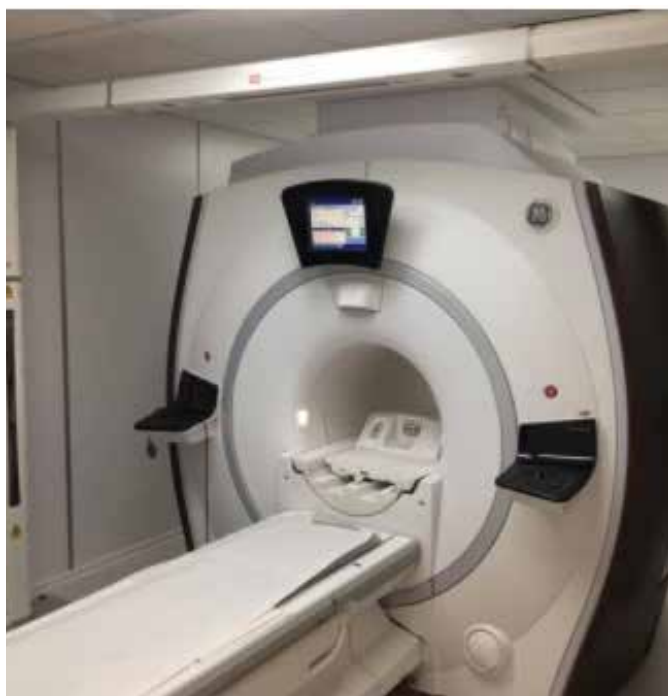
Slika 2: MR simulator Optima 450w GEM SUITE - General Electric z laserskim sistemom Dorado za pozicioniranje pacienta.

1 - https://www.lap-laser.com/medical-systems/patient-marking/moving-laser-systems/dorado/