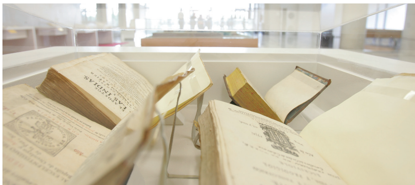
Exposición de Fondo Antiguo en el vestíbulo de la Biblioteca de Humanidades.

La Biblioteca prepara cada año varias exposiciones de sus fondos en el vestíbulo de la Biblioteca de Humanidades, la mayoría con material de nuestro Fondo Antiguo. Paralelamente se presenta una exposición virtual en la página web de la Biblioteca. Actualmente hay más de 35 exposiciones virtuales publicadas.