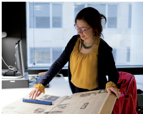
Escáner de mano para materiales de prensa.

La Biblioteca dispone de máquinas de autoservicio para la reproducción de documentos, ya sea mediante fotocopias, impresión, escaneado o digitalización.