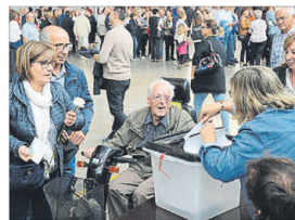
Votación en un colegio de Les Borges Blanques (les Garrigues)

El alcalde rectifica un comentario en el que calificó de proporcionada la actuación de la policía