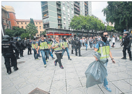
Los agentes tras retirar las urnas del IES Tarragona, donde se vivieron momentos de máxima tensión

La Policía Nacional irrumpe primero en los barrios y luego en el centro, en una decena de sedes electorales de la ciudad de Tarragona