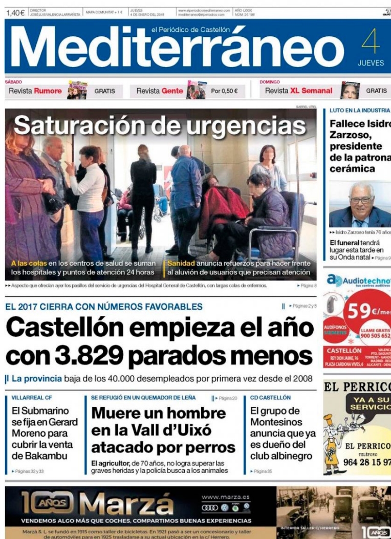
Imagen 1. Portada de Mediterráneo

Argumenta cuál de las tres características esenciales de la noticia (novedad, excepcionalidad e interés general) crees que predomina en las noticias seleccionadas de las dos portadas reproducidas a continuación.