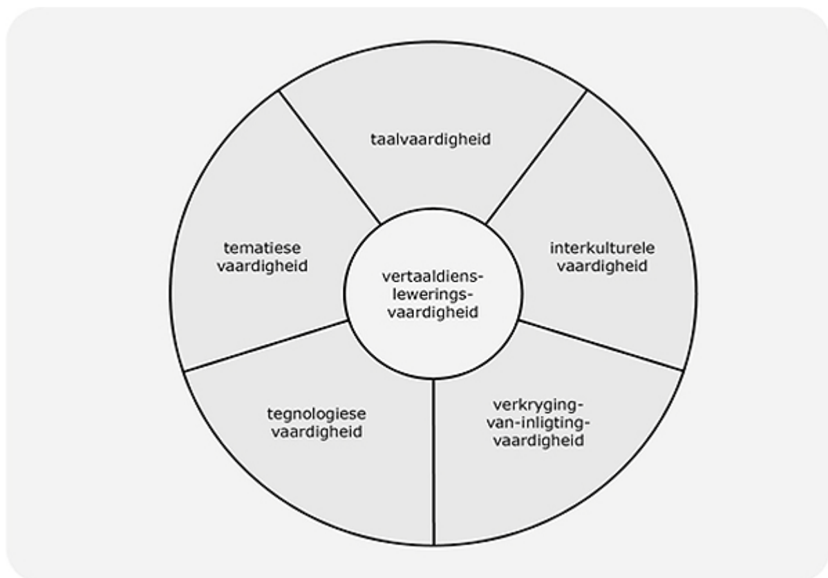
Figuur 3. Die EMT-groep se vertaalvermoëmodel

Die EMT-groep definieer vermoë ( competence ) as “the combination of aptitudes, knowledge, behaviour and know-how necessary to carry out a given task under given conditions” en spesifiseer (soos PACTE en die TransComp-projek) dat die vaardighede in die ses areas wat hulle geïdentifiseer het, onderling verbonde is met mekaar (EMT 2009:3). Kyk figuur 3 vir ’n grafiese voorstelling van hierdie model (EMT 2009:4).