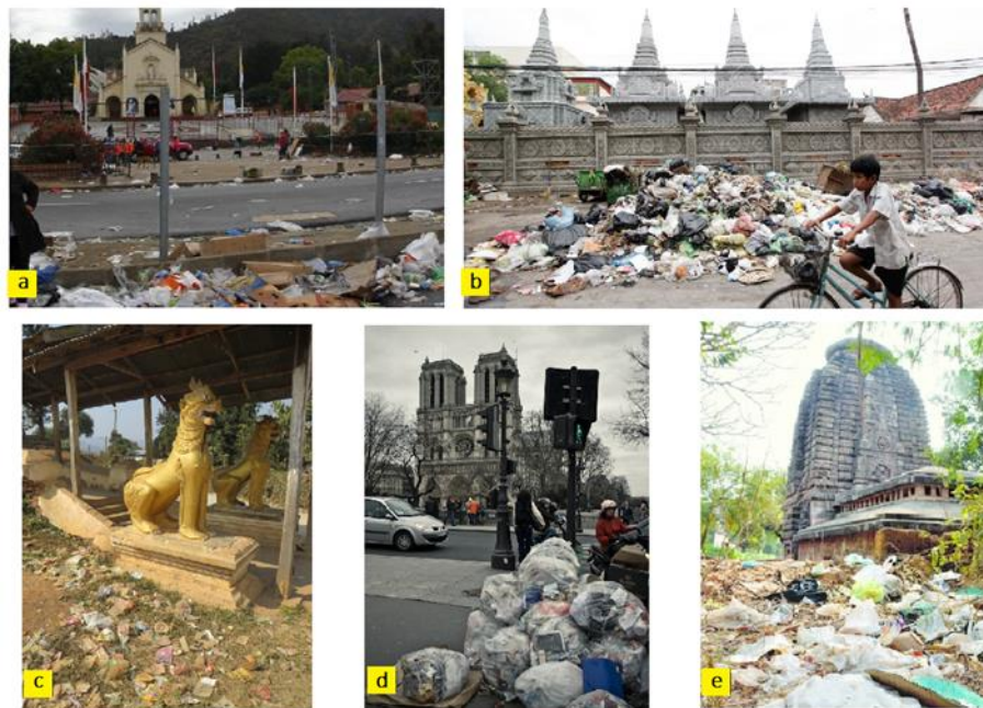
Figura 1. Contaminación del ambiente producto directo de prácticas religiosas

no ha llamado el interés entre los estudiosos, sólo existe interés mediático como el que se describe en la figura 1.