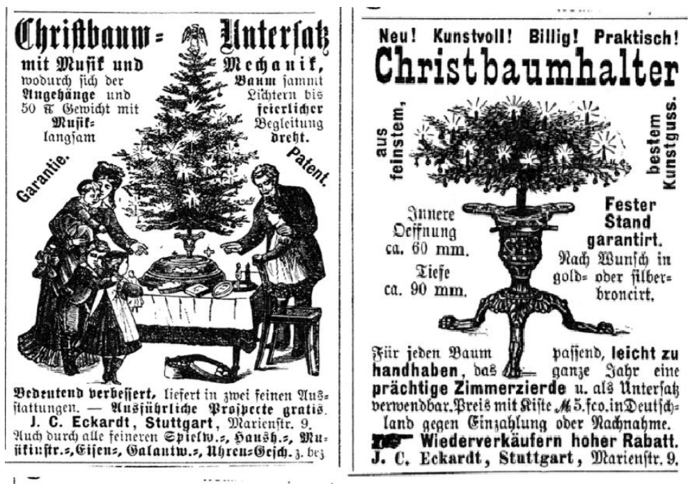
Figura 5. Anuncios publicitarios del árbol de Navidad en el periódico político semanario alemán Fliegende Blätter del 29 de noviembre de 1885.

navideños en una granja de piceas cerca de Trenton, Nueva Jersey 48 , para mediados de la década de 1920 el uso de árboles de Navidad se había extendido a todas las clases sociales. Hemos estimado que a nivel mundial, en función de los 20 millones de familias cristianas con posibilidad económica de adquirir un árbol navideño hacia 1925, por lo menos se cortaron más de nueve millones de árboles para cubrir sólo el 40% de semejante mercado. Cabe señalar que desde 1923, en el jardín sur de la Casa Blanca, se enciende el árbol de Navidad con luces eléctricas 49 , y desde 1931 el Rockefeller Center colocó su afamado árbol navideño.