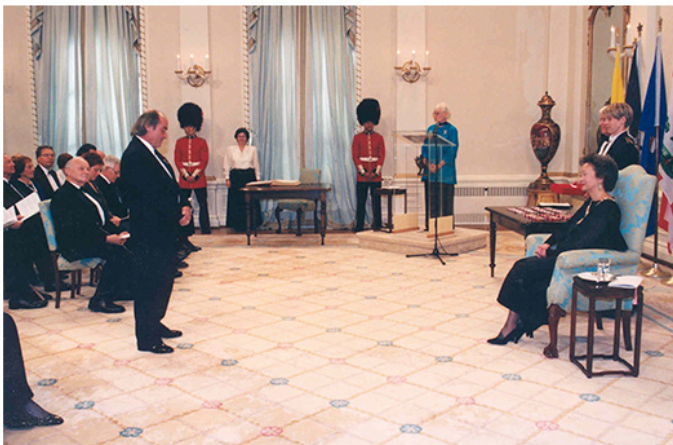
Georges receiving the Order of Canada.

the keynote address at the 2000 Joint Annual Meeting of the Entomological Societies of America, Canada, and Quebec.