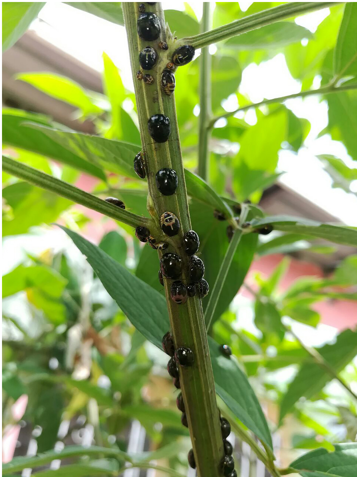
Figura 1. Vista de ejemplares vivos de Brachyplatys subaeneus en guandú ( Cajanus cajan ).