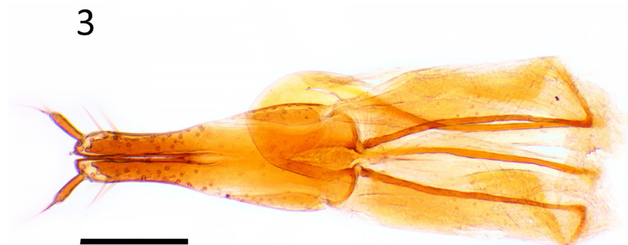
Figura 3. Genitalia femenina de Omosita colon , vista ventral (escala: 0.2 mm).