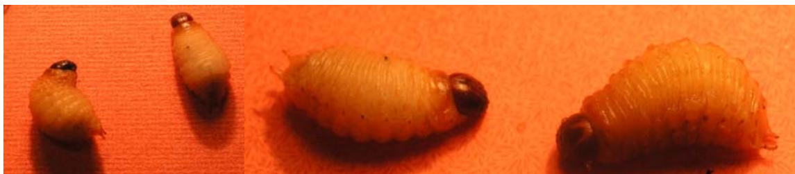
FIG. 2. Fully developed larvae of Scyphophorus acupunctatus .