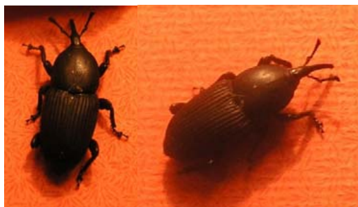
FIG. 1. Adults of Scyphophorus acupunctatus .

Adults of S. acupunctatus are small black weevils, 9-15 mm long (Fig. 1). The larval stage completes its development within 5 instars. The fully developed larva is about 18 mm long, creamy white and legless (Fig. 2). Pupation takes place within a cocoon maiden by plant fibres. The total life cycle lasts 50-90 days. In cases of severe attacks, plants may die mainly from the feeding activity of the larvae which bore galleries into the infested plants, whereas adult damage consists of feeding punctures on young leaves.