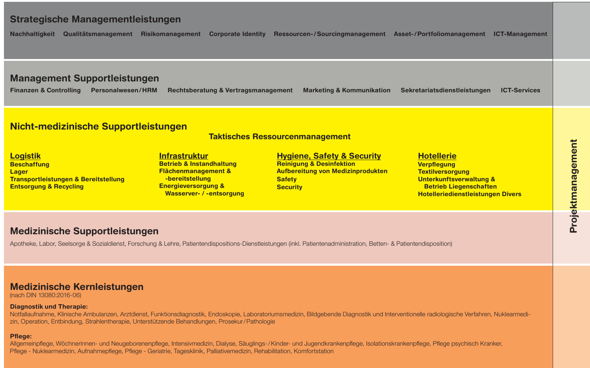
Abbildung 2: Zuordnungsmodell medizinische und nicht-medizinische Leistungen im Spital, Version 4.0

Die Darstellung der Unterteilung der Leistungsebenen im Spital wurde bereits mehrfach adaptiert. Hier wird eine weitere Kleinkorrektur in Bezug auf die Bereichs-Bezeichnung vorgenommen: Facility Services werden zu Hygiene, Safety & Security umbenannt. Zudem werden die Management-Supportleistungen gemäss den Aktualisierungen im Katalog ergänzt.