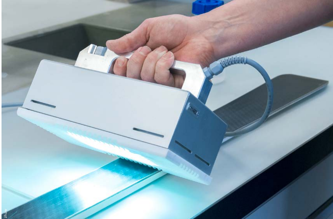
Bild 3: Sobald die Technologie fortgeschrittener ist – die Quecksilberdampflampen sind noch zu teuer – wird das photoreaktive Skiwachs auf den Markt kommen und für den Breitensport zugänglich sein.

Ermutig von den Labortests folgten ausgedehnte Feldtests mit professionellen Skirennfahrern. Im Fokus stand der Skilanglauf, weil die Randbedingungen dabei besser kontrolliert werden können. Gemessen wurde einmal der Zeitgewinn bei kurzen Abfahrten und, wichtiger noch, das Gefühl der Profis für das neue Wachs. Bei kalten Bedingungen erwies sich photoreaktives Skiwachs als das reibungsärmste, bei warmen Bedingungen waren die Unterschiede zu konventionellen Hochleistungswachsen weniger ausgeprägt. Der Zeitgewinn lag bei 0,1–0,3 Sekunden auf