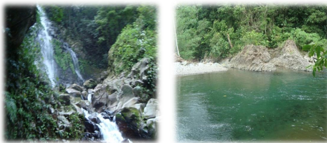
Figuras 5 y 6 - Cascada y poza Selva del Marinero

guías se han dado cuenta que es la hora en la que están presentes las aves, mientras que los demás recorridos sugieren se lleven a cabo antes de las seis de las tarde con la finalidad de que el visitante pueda disfrutar del paseo. Los encargados de fungir como guías de turismo son los hombres que, al igual que las mujeres, tienen su comisión y tomaron cursos de capacitación para poder tener el cargo.