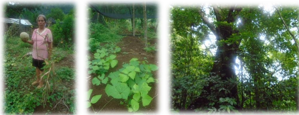
Figuras 7 y 8 - Conservación ambiental

Por otra parte, el proceso de creación del ANP también, generó expropiaciones ejidales con la finalidad de preservar, conservar y restaurar el equilibrio ecológico en la zona. Ante el deterioro y pérdida de biodiversidad en el sitio por la explotación que se le daba al espacio natural antes de los diversos decretos de ANP, varios de los habitantes del ejido, por decisión propia, empezaron a cuidar de los recursos naturales con la finalidad de utilizarlos en sus necesidades básicas y al mismo tiempo conservarlos para los futuros habitantes, dando así un mayor valor tanto al espacio físico como a los recursos disponibles en ese momento.