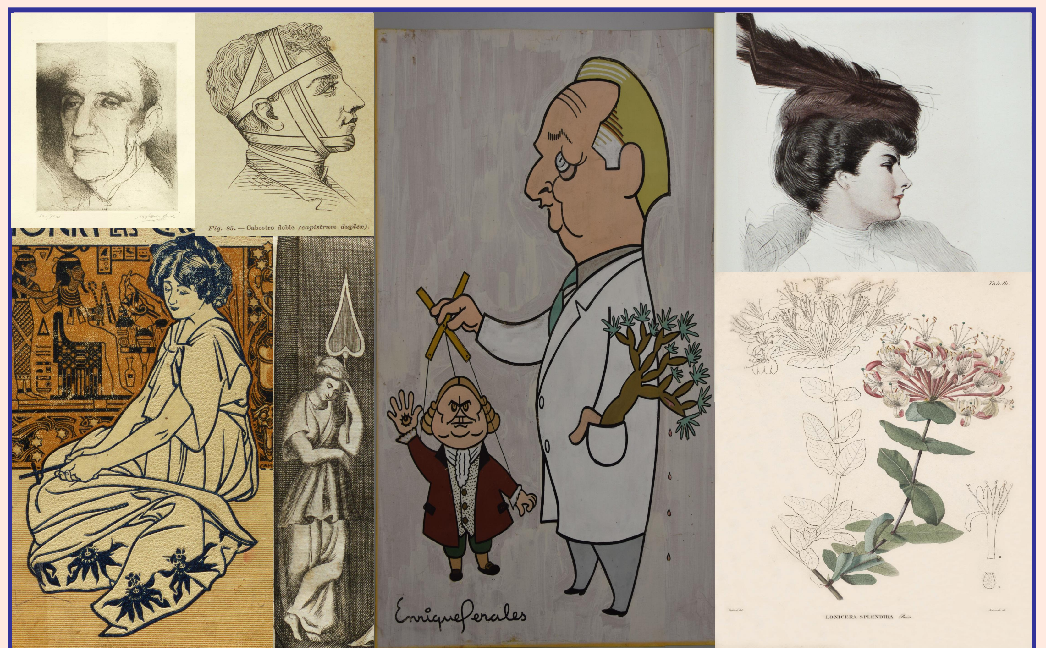
Imágenes incluidas en el catálogo