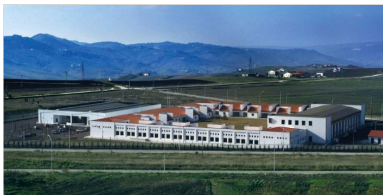
Figura 2. Centro di Ricerca Biogem (Ariano Irpino).

Biogem (Biologia e genetica molecolare) è una Società Consortile costituita dal Consiglio Nazionale delle Ricerche (CNR), dalla Stazione Zoologica "Anton Dohrn" di Napoli, dall'Università Federico II di Napoli, da IRCCS e da enti locali. Nasce nel 2006 dall'idea di Gaetano Salvatore e di Ortensio Zecchino, volta alla realizzazione di un centro polifunzionale in grado di contribuire all'avanzamento di ricerca scientifica, trasferimento delle conoscenze al mondo della salute e dell'industria, offerta di formazione e divulgazione scientifica e realizzazione di servizi avanzati per Life and Mind Science. Tutti i partecipanti al meeting hanno avuto la possibilità di visitare il bellissimo complesso, che occupa una su-