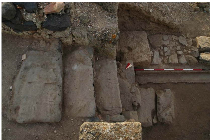
Fig. 7. La scala che collega gli ambienti Aa e Ac.

Perimetrale orientale dell'ambiente Ac è la stessa struttura muraria che continua senza interruzioni (ma ad una quota decisamente più bassa) dall'ambiente Aa. L'ipotesi che il vano possa aver vissuto due fasi distinte (cioè di piano terra in un primo momento e successivamente di cantina interrata) può esser avallata dalla presenza nel muro di quella che sembra essere una tamponatura con pietre e laterizi di piccole dimensioni all'interno di una struttura muraria che invece è formata da blocchi di arenaria squadrati di dimensioni ben maggiori.