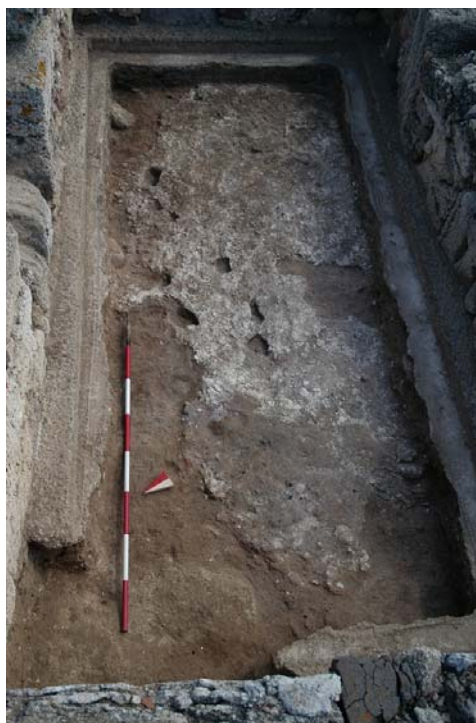
Fig. 4. Il pavimento in calce bianca dell'ambiente Ab.