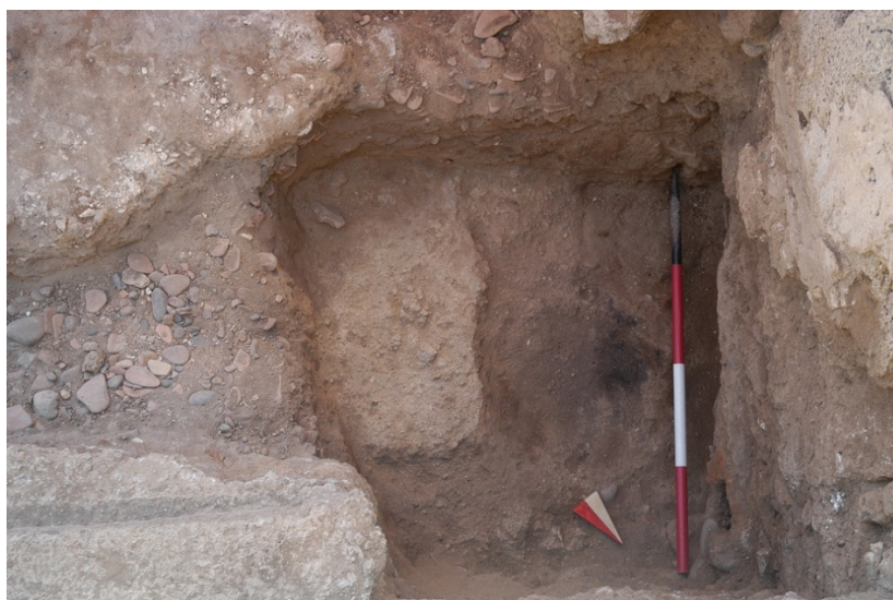
Fig. 6. Il saggio nell'ambiente Ab e il lacerto pavimentale più antico.

Il saggio stratigrafico risulta circoscritto ad un'area quadrata di 80 cm per lato, nell'angolo nord-ovest del vano Ab. L'asportazione dello strato "vespaio", composto da ciottoli e cocci arrotondati, ha portato alla luce, ad una quota più bassa di 15 cm, un ulteriore strato argillo-sabbioso con all'interno vari frustoli carboniosi e cenere di colore scuro, e una "lente" di bruciato più grande. Alla stessa quota della lente di bruciato, è stato rinvenuto un ulteriore strato pavimentale, di cui si è potuto identificare una parte nella porzione sud-est del saggio. Tale strato (Fig. 6), costituito da calce altamente friabile; sembra inoltre proseguire al di sotto dei limiti del saggio, verso sud e verso est.