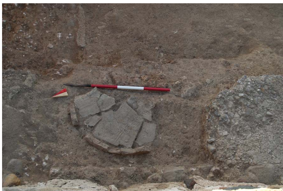
Fig. 11. Il tannur posto nell'angolo N-O del vano Ae.