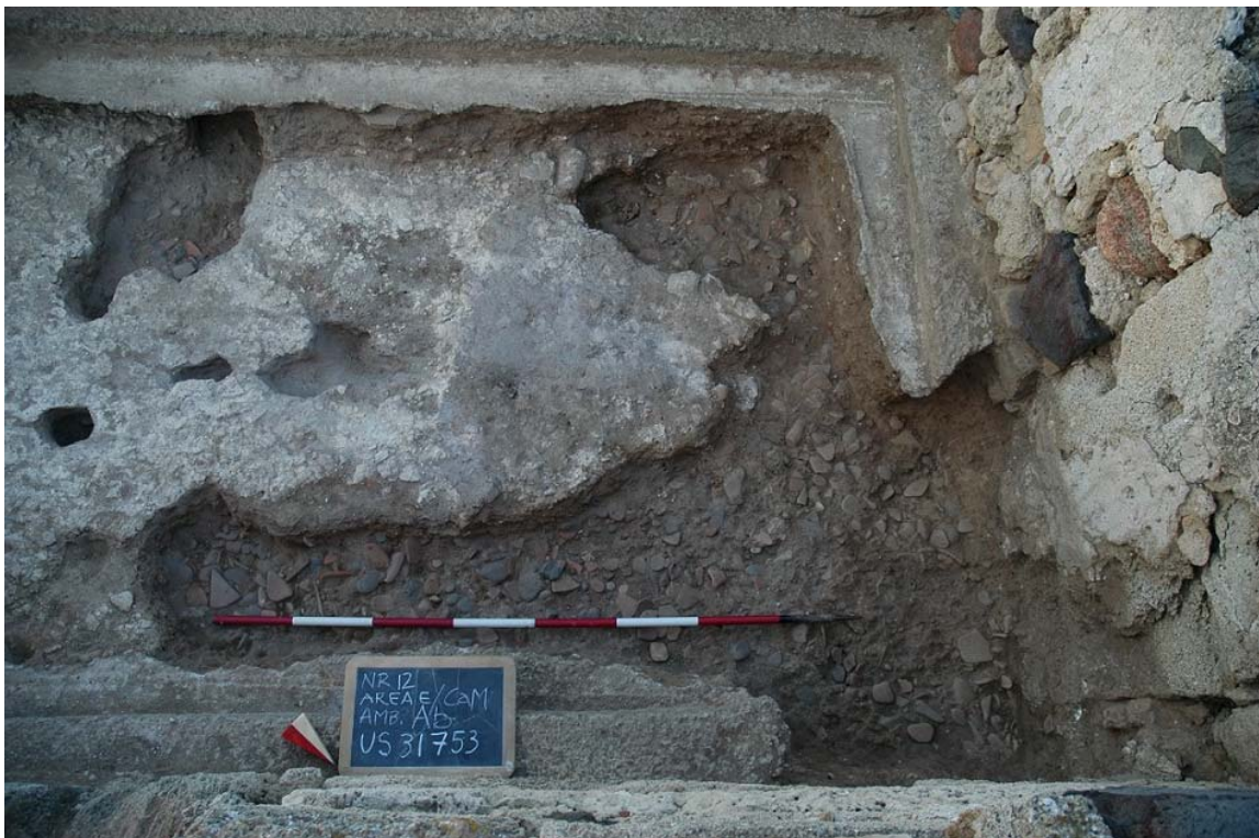
Fig. 5. Lo strato "vespaio" di cocci e ciottoli arrotondati sottoposto al pavimento del vano Ab.