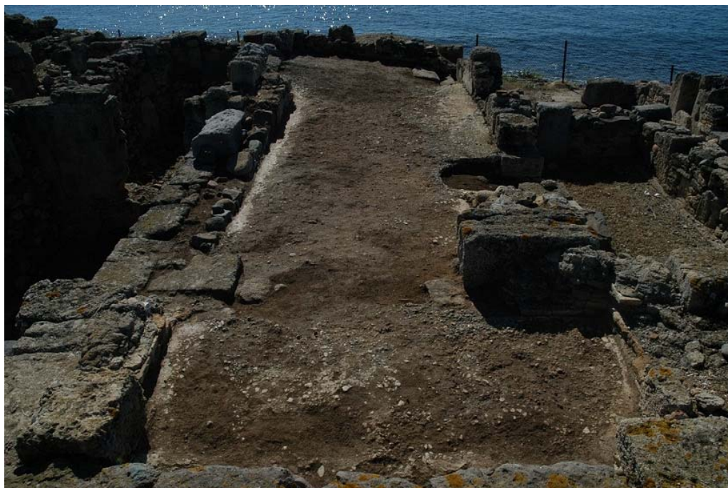
Fig. 2. L'ambiente Aa. In primo piano il vestibolo di ingresso.

All'interno del vano maggiore di Aa sono presenti due ulteriori strutture murarie, appoggiate lungo il lato maggiore ai perimetrali nord e sud dell'ambiente: se quello meridionale, altamente lacunoso, si imposta direttamente sul piano pavimentale, e dunque ne ipotizza una costruzione successiva o addirittura recente, quello settentrionale, molto più lungo, appare funzionale all'imposta del pavimento stesso, e presenta nella parte orientale alcune tracce di intonaco. In diversi punti dell'ambiente Aa, sulla fronte interna dei muri, si conservano altri lacerti di intonaco; quello meglio preservato, posto nella parte orientale del muro perimetrale sud per circa un metro di lunghezza e circa 30-40 cm in altezza, presenta ancora una tenue colorazione rosata originale (Fig. 3).