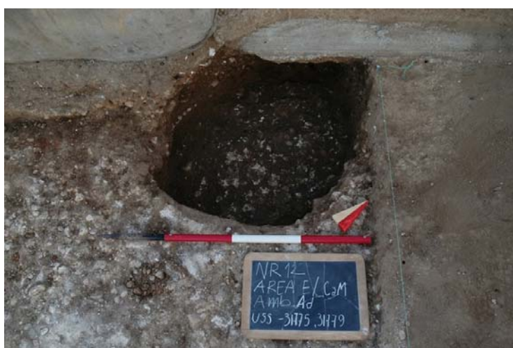
Fig. 9. I due piani pavimentali rinvenuti nel saggio dell'ambiente Ad.

Nella struttura perimetrale occidentale, invece, la chiara tamponatura di una sua porzione, che presentava inoltre la fronte sud intonacata, ha fatto supporre che in una delle precedenti fasi edilizie del vano, in questo punto, ci potesse essere un passaggio forse in diretta connessione con la strada a ovest.