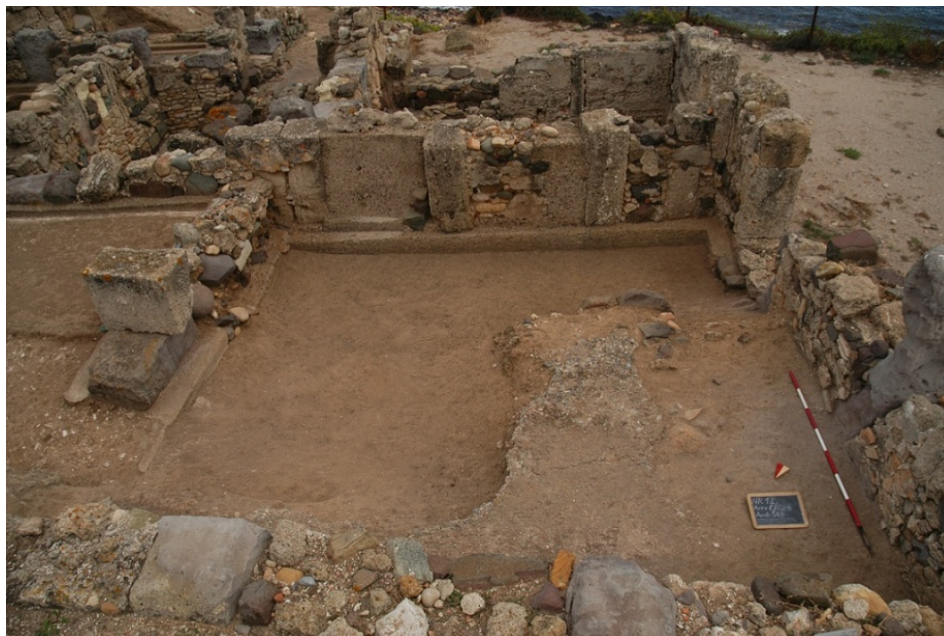
Fig. 10. L'ambiente Ae con il pavimento in primo piano sulla destra.

numerosi frammenti di laterizi bruciati, pertinenti al tannur , probabilmente crollati in epoca moderna in seguito al rinvenimento del forno 15 .