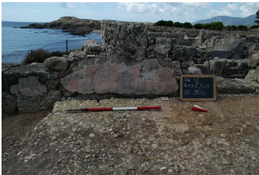
Fig. 3. Il lacerto di intonaco originale nell'ambiente Aa.

s.l.m.m.), costituito da calce abbastanza friabile e pietrame di piccole dimensioni, tagliato in vari punti (Fig. 4). Questo pavimento, coperto nella sua porzione occidentale da un sottilissimo strato di cenere, è tagliato al centro da cinque buche di palo di varia forma e dimensioni; inoltre, all'estremità ovest, è stato rinvenuto, inglobato nella preparazione di calce del pavimento stesso, il fondo e parte del corpo di un piatto da mensa in vernice nera locale. L'asportazione del reperto ha evidenziato uno strato di preparazione pavimentale, costituito da matrice sabbiosa molto fine di colore marrone scuro.