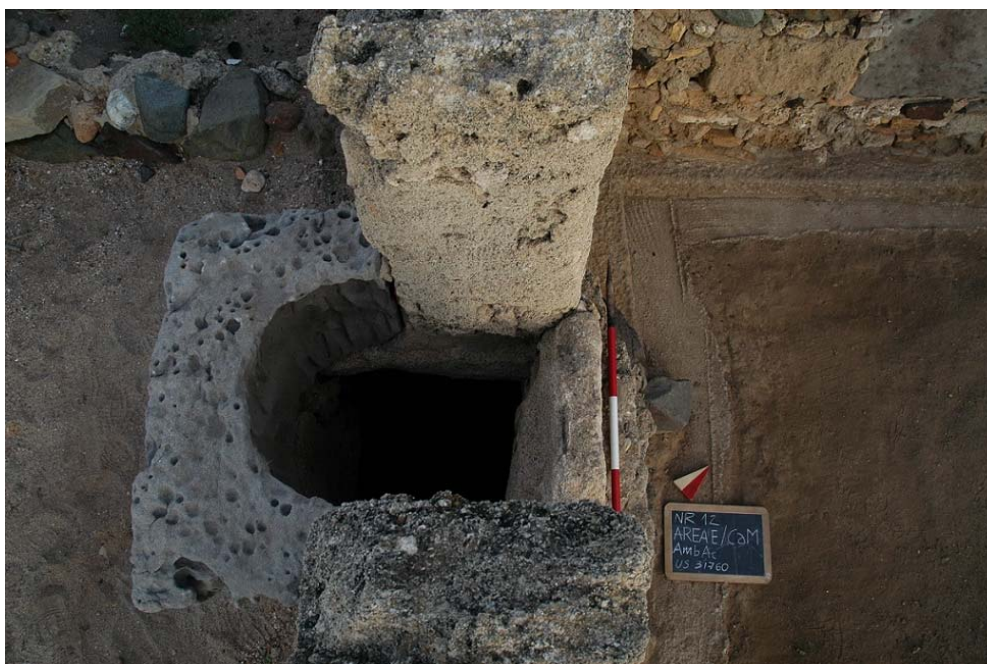
Fig. 8. Il pozzo dell'ambiente Ac visto dall'alto.

In questo ambiente lo scavo in profondità si è limitato alla parziale asportazione dello strato superficiale fino alla quota delle solette cementizie moderne che circondano l'intero vano eccetto per la parte finale della scala; il piano pavimentale in ciottoli descritto dal Pesce non è però stato ritrovato. Inoltre sono stati messi in luce alcuni blocchi sbozzati di andesite di grandi dimensioni immersi nella matrice dello strato: uno verso sud, uno verso est, entrambi in prossimità delle solette cementizie, ed uno verso nord, subito sottostante al gradino più basso della scala, tale da ipotizzarne una sua identica funzione, in fase di crollo.