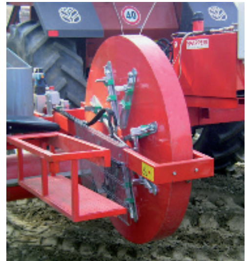
Dettaglio del disco con le pinze per l'inserimento delle talee della trapiantatrice a dischi Spapperi.