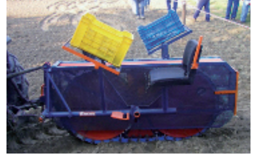
Trapiantatrice Rotor a cingolo; in primo piano la postazione dell'operatore e le cassette entro cui vengono collocate le talee da mettere a dimora.