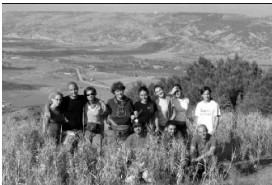
Figura 2 – Il gruppo dell'ottobre 2007 a Monte Finese (Pisticci, Mt), sullo sfondo la valle del Basento.