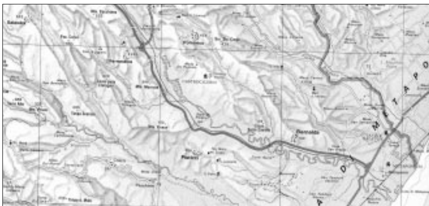
Figura 1 – Metaponto e l'immediato entroterra (elaborazione da Grande Atlante d'Italia De Agostini, Novara 1988).