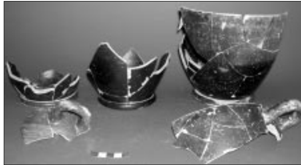
Figura 5 – Cozzo Lattegana, parte degli skyphoi a vernice nera.