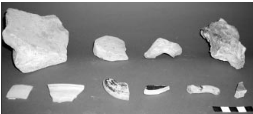
Figura 7 – Fornaci Tredicicchio, materiali dalla raccolta di superficie.