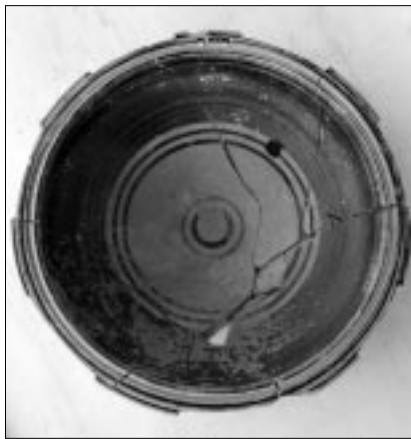
Figura 6 – Cozzo Lattegana, patera a fasce.