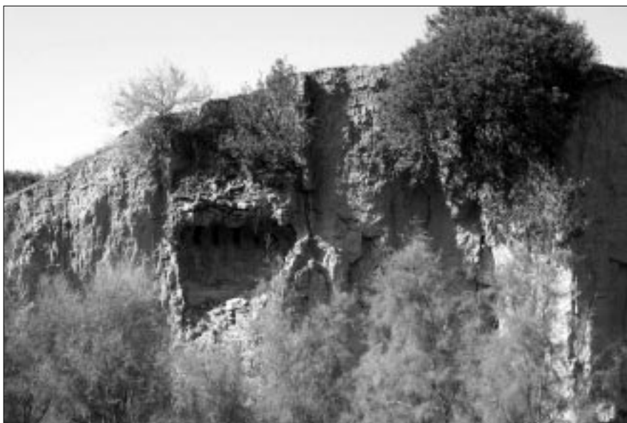
Figura 4 – La fornace in località Piana della Cisterna, a Ferrandina.