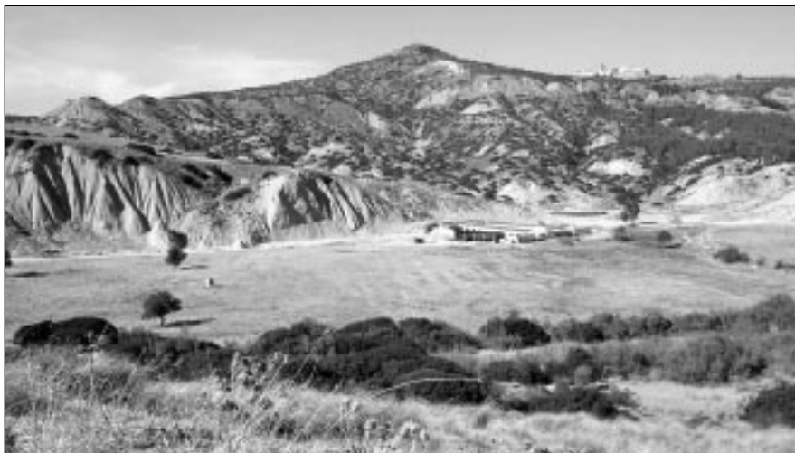
Figura 3 – Coste della Cretagna (Ferrandina, Mt). Iazzo Trediciccio: in primo piano il corso del Vella, sullo sfondo i calanchi e Ferrandina.