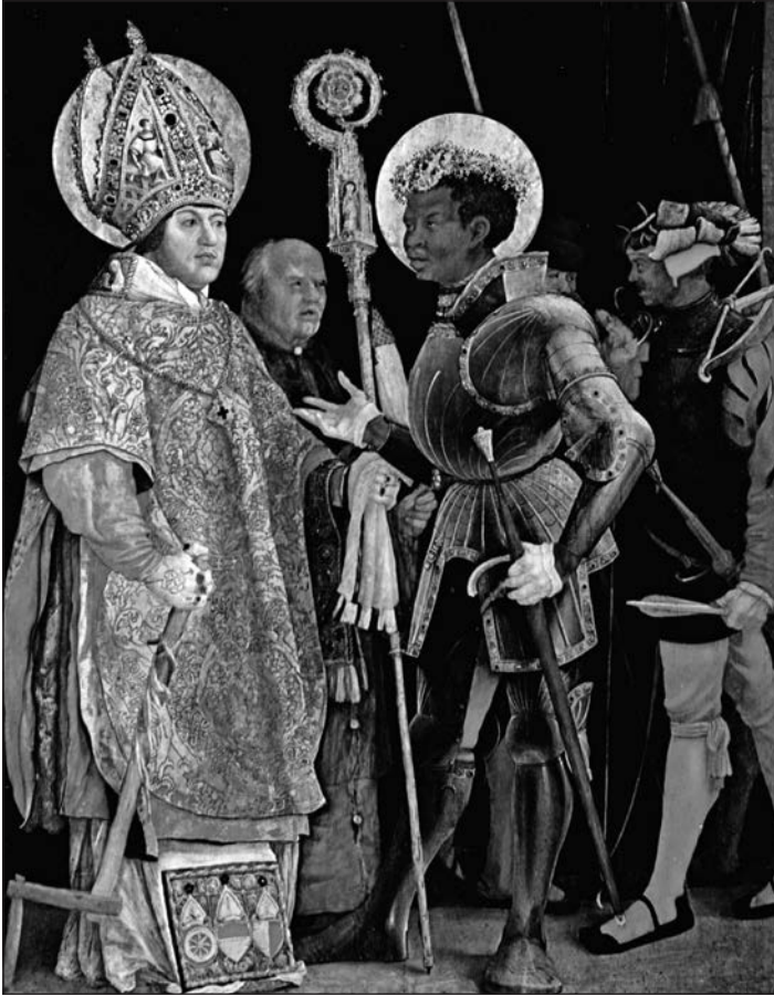
4. kép. Matthias Grünewald: Szent Móric és Szent Erasmus (1517–1523)

Móric karcsúsága közötti kontrasztot. A különbséget még inkább kihangsúlyozzák a bíboros fényűző és nehéz liturgikus ruhái, szemben a gáláns lovag étellel teli, könnyed eleganciájával.