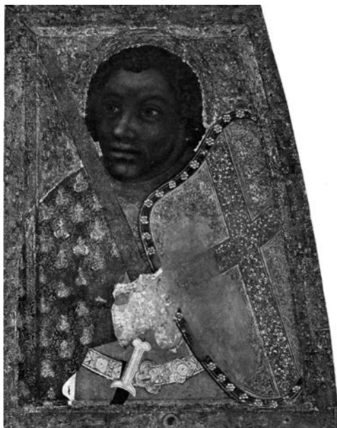
2. kép. Magister Theodoricus: Szent Móric (1360 körül)

rát, melynek megmaradtak értékes, hímzett ruhái is. 15 Arcvonásai nyugati lovagot mintáznak, hajviselete francia, s udvari viseletben jelenik meg, akárcsak a naumburgi szobor. A négerfejekkel díszített pajzs későbbi hozzátoldás.