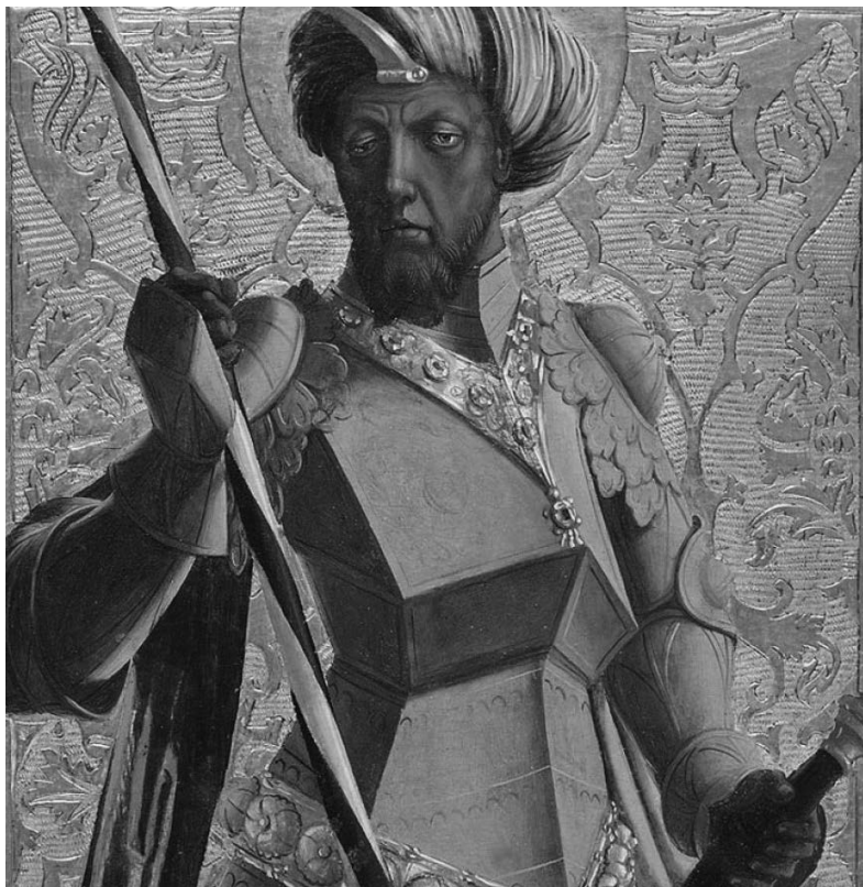
5. kép. Szent Móric Marx Reichlich táblaképén (részlet)

(Nem csoda, ha Luther Márton tüzet okádott a „hallei bálvány” ellen. Nem egészen húsz évvel később maga a bíboros volt kénytelen szétbontani a szobrot, hogy adósságait ki tudja fizetni.) Az így ábrázolt Móric már nemcsak a magdeburgi egyházmegye védőszentje, hanem az egész birodalomé. Albert Németország prímási címére tartott igényt, azaz a pápa után a katolikus egyház legmagasabb tisztségére tört, miközben a birodalom kancellárja is volt.