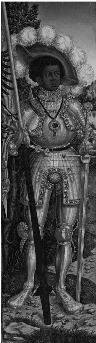
3. kép. Id. Lucas Cranach: Szent Móric (1520–1525)

A 15. század végére a fekete Szent Móric szinte mindenhol megjelent a birodalom területén. Ragyogó pompában ábrázolták, egzotikus ruhákban, hallatlan gazdagsággal, néhol még fülbevalóval is ellátták. Bizonyos művészeknél az afrikai vonások egyre inkább keveredtek török és más keleti elemekkel. Az afrikai szent ábrázolása a művészek számára lehetőséget kínált képzeletbeli és szürreális ruhák és kiegészítők kitalálására. Ennek a kornak példárértékű személyisége volt Brandenburi Albert bíboros a Hohenzollern-dinasztiából. 21 Hatalma kiterjedt a magdeburgi, a halberstadti és a mainzi püspökség területére is (1513–1541). A kor legnevesebb művészeitől rendelt Móric-képeket, köztük Lucas Cranachtól és Matthias Grünewaldtól (3–4. kép). 22 A bíboros büszkeségét hatásosan fejezi ki Grünewald táblaképe, mely eredetileg Halle székesegyházának készült, de jelenleg Münchenben látható. A festményen anakronisztikus jelenet látható: Szent Erasmus fogadja Szent Móric látogatását. 23 Erasmust, a brandenburgi ház védőszentjét a festő a megrendelő bíboros vonásaival örökítette meg. A művész kiemeli a túlsúlyos egyházfő és a