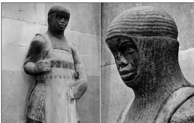
1. kép. Szent Móric szobra a magdeburgi székesegyházban

Miért nem ábrázolták a művészek ebben a korban Móricot afrikai arcvonásokkal? Hiszen lehetőségük lett volna rá, a kor művészete pedig a realizmus felé hajlott. A jelenségnek két oka van: a fekete színnel kapcsolatos előítéletek, valamint az afrikai arcvonások iránti megvetés. A fekete az ördög és a gonosztevők színe volt. Úgy tartották, hogy az afrikaiak fekete bőre Noé fiának, Kám bűntetésének következménye, aki az afrikaiak ősatyja. Kámot ugyanis, miután kigúnyolta a részegségében mezítelenül fekvő Noét, apja megátkozta. Fia, Kánaán a következő ítéletet vonta magára: „Legyen a legkisebb szolga testvérei között!” (Ter 9,25). Emiatt egyesek az afrikaiak arcvonásaiban az eszményi arc torzulását látták. Így tehát egy színes bőrű szent teljességgel elképzelhetetlen volt. A „feketeségtől” és a hozzá kapcsolódó negatív képzetektől való félelem még ma is tetten érhető az olyan kifejezésekben, mint a „feketehumor”, a „feketegazdaság” vagy a „feketézés”.