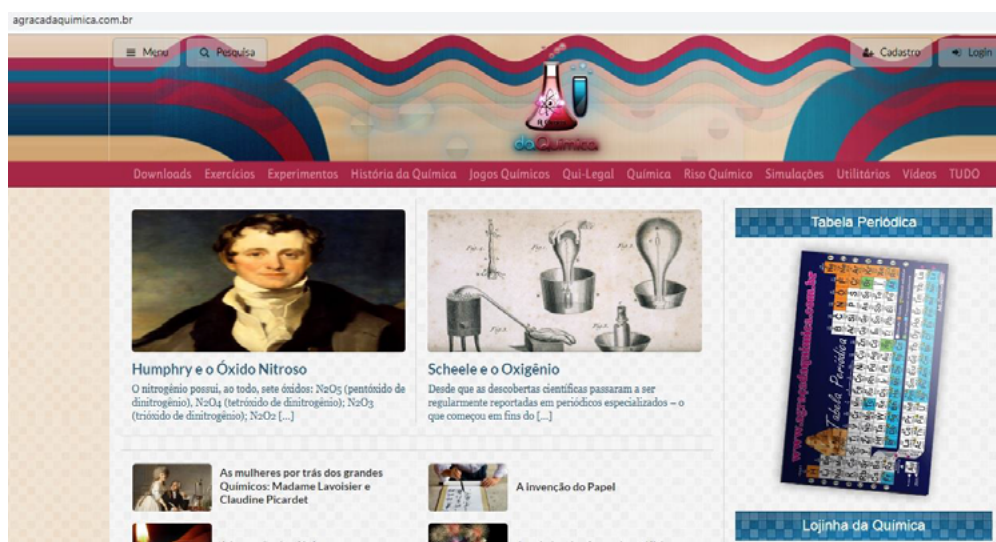
Figura 2: Tela inicial do site A Graça da Química.