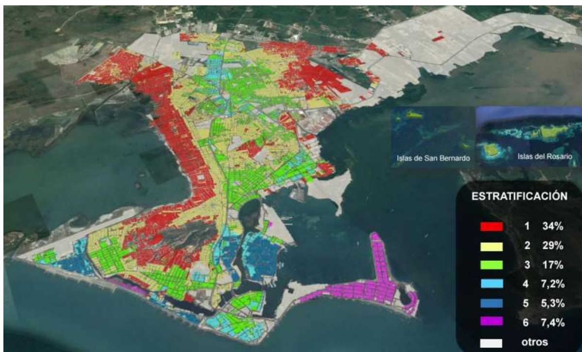
Mapa 3 Mapa temático de la estratificación de los barrios en Cartagena. Como se puede evidencia, los estratos 1 y 2 ocupan la mayoría del territorio y se concentran en algunas áreas de interés.

Lo que primero salta a la vista, es la relación de los planes habitacionales ya finalizados o en fase de consolidación; en todos ellos se puede observar un común denominador: la marginalización. Todos se presentan como conjuntos de alta densidad horizontal, ubicados en zonas no urbanizadas (incluso áreas anteriormente rurales), sin equipamientos públicos y distantes del centro y de los principales lugares de trabajo 11 .