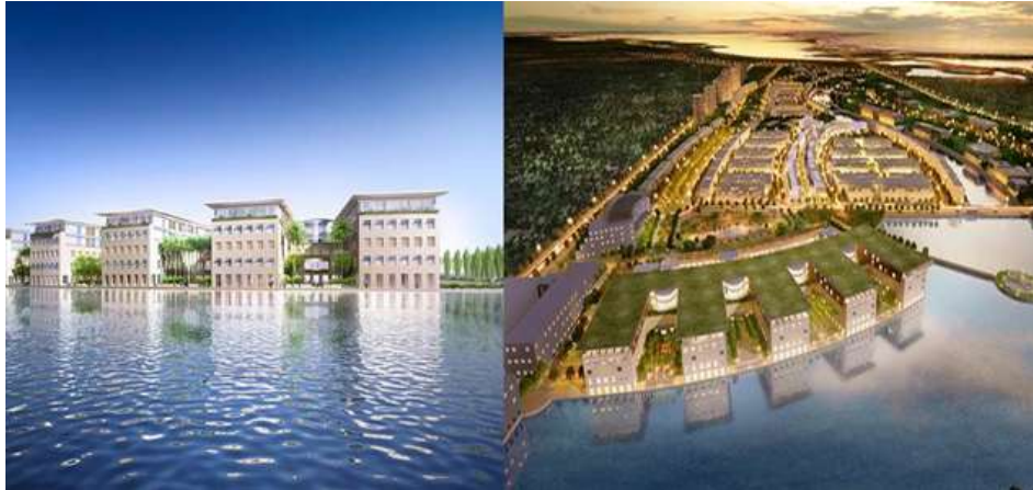
Imagen 6 Render proyecto Serena del Mar en la Boquilla. Condominios Morros IOs y Hospital Serena del Mar.

En esta misma línea, más con una escala mucho mayor, la alcaldía y el sector privado presentan el megaproyecto La Serena del Mar propuesto sobre el municipio vecino de La Boquilla (Mapa 2 y 4). Este megaproyecto reúne todos los clichés de emprendimientos de residencias privados de alto padrón y de turismo de lujo: campos de golf, muelles privados para yates, acceso privado a playas privadas, condominios modernos con fachadas de cristal con vistas a la Ciénaga y el Caribe (Imagen 6).