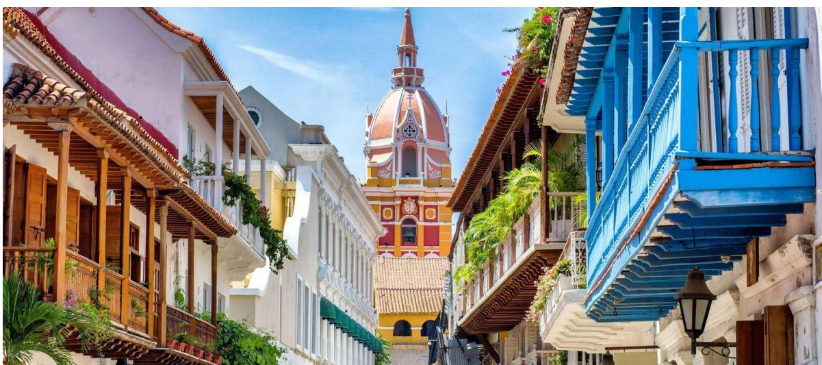
Imagen 4 Fotografía del centro histórico de Cartagena, con los característicos balcones y el remate visual de la Catedral en el fondo.