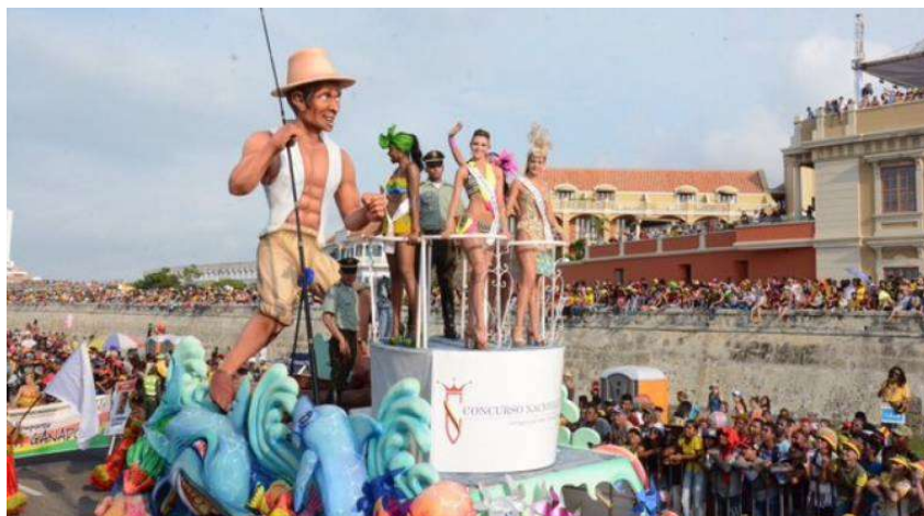
Imagen 2 Desfile de fragatas del concurso nacional de belleza señorita Colombia.

La realización de eventos culturales y de entretenimiento suntuosos los cuales reunían personalidades y dirigentes del país (Imagen 2), así como la consolidación de Cartagena como ciudad diplomática con la construcción de la Casa de Huéspedes Ilustres (1973) y a su entorno, la construcción de los barrios militares y de funcionarios medios en Isla Manzanillo, sirvieron a la creación de esta imagen de ciudad internacional y a la espacialización de la misma, ya que significaba la “higienización” de una parte negra de la ciudad. (Mapa 1) (Stolker, 2017, pág. 26) (Redondo, 2004, págs. 83-84)