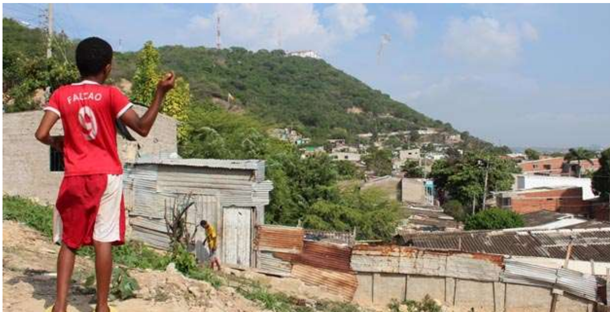
Imagen 5 Fotografía de un asentamiento en el Cerro de La Popa, Cartagena.

La concentración de los esfuerzos y recursos en privilegiar la actividad turística e inmobiliaria y a sus elites envueltas, junto con el rápido crecimiento poblacional de la ciudad 7 y la carencia de políticas públicas y planes sociales que den cuenta de las demandas por vivienda y empleo, han propiciado que los habitantes de Cartagena busquen alternativas por cuenta propia como lo son la ocupación y la autoconstrucción como vías para asegurar un derecho de acceso al centro, en donde se concentran las actividades comerciales y de servicios en las cuales la mayoría se emplea, paradójicamente ligadas al turismo 8 . Las áreas de libres de riesgo en zonas cercanas al centro como la línea costera de la Ciénaga de Tesca y las faldas del Cerro de La Popa (Imagen 5) se vieron rápidamente ocupadas y urbanizadas en un proceso comparable con de las favelas de los morros en Rio de Janeiro, ya que en los dos casos la ocupación de estos espacios se da por la persistencia en la marginalización de las comunidades - especialmente las racializadas- de la ciudad formal, siendo que la territorialización de estos locales se expresa como una contestación al orden segregador y como el aprovechamiento de la localización, una infraestructura y equipamientos consolidados, y el atractivo paisajístico del lugar, creando un lazo, soluciones constructivas y un cotidiano singular por parte de estas poblaciones. (Cabeza, 2013, págs. 260-261)