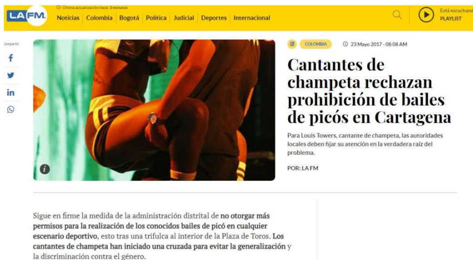
Imagen 13 Encabezado de noticias donde se anuncia la prohibición por parte de las autoridades locales de los bailes de Picó en Cartagena, 2017.

Las autoridades y gobiernos locales a pesar de permisivos con excesos protagonizados por turistas y las élites criollas, muestra su racismo y desdén a expresiones culturales afrocartageneras cuando criminaliza e incluso prohíbe su socialización. El último caso fue la prohibición de realización de toques de champeta -también llamados de Picó-. Este género al margen del mercado dominante de música comercial, por su procedencia es desdeñado, criminalizado y tenido como una baja expresión musical; éste surge en la marginalización y reúne toda la herencia africana y la combina con letras y sonidos sacados del Caribe, son característicos de la ciudad y parte importante de la configuración de la socialización barrial, los espacios y momentos de reunión de las comunidades. (Imagen 13)