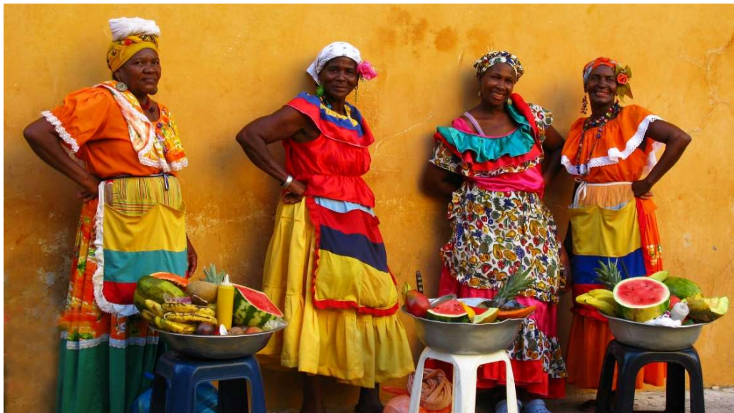
Imagen 9 Fotografía icónica de Las Palenqueras en el centro de la Amurallada.

(...) “A nosotras nada nos regalan. Hasta los uniformes que tenemos puestos lo compramos. Nos salen en más de cien mil pesos, porque nos vale 60 mil pesos la tela, y nos cobran 45 mil por la costura. Los turistas muchas veces no tienen la delicadeza de decirnos: ¿Puedo hacerle una foto? Sino que van haciendo la foto sin pedirnos permiso. A veces, los mismos turistas que han escuchado la difamación en boca del guía, vienen hasta nosotras con risita burlona creyendo en verdad que estamos trabajando para que un marido esté tirado en una hamaca rascándose las que sabemos, pero eso no es así. Si ellos están en Palenque están cuidando, sembrando o atendiendo la siembra. Si están en Cartagena, también están trabajando en otras cosas, para sostener a la familia. Relato de Narcilia Valdés Salgado, pariente del difunto Paulino Salgado y José Valdés Simanca, tiene 42 años, madre soltera, 22 años vendiendo dulces en Manga y en el corazón amurallado de Cartagena. (Salgado, 2018)