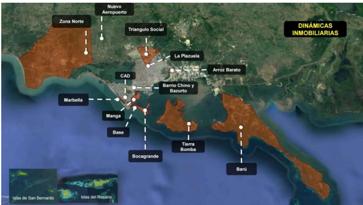
Mapa 4 Mapa de espacialización de los intereses y desarrollos inmobiliarios y turísticos en la ciudad.

De modo contrario, cuando los lugares están en áreas de interés del turismo y del mercado inmobiliario, se acude a las denominaciones como “revitalización” “renovación” o “recuperación” de sectores, bajo la excusa de una degradación del lugar, la inseguridad o un riesgo ambiental. Estos proyectos oportunamente son notados cuando el mercado posó su interés sobre ellos y la población que sistemáticamente ha sido ignorada por su clase y raza se perfila como obstáculo para el desarrollo y/o un futuro ex morador del lugar. Ese podría ser el caso del proyecto de “recuperación” planteado para el Mercado popular Bazurto 12 y su área circundante que en la presentación las autoridades muestran su preocupación con la seguridad del sector, pareciendo que la única salida es la salida misma de los habitantes, trabajadores y frequentadores habituales del local, y el posible reemplazo por otros con mayor poder adquisitivo, en vez de plantearse políticas e incremento del gasto social y repartición de las riquezas. (Mapa 4)