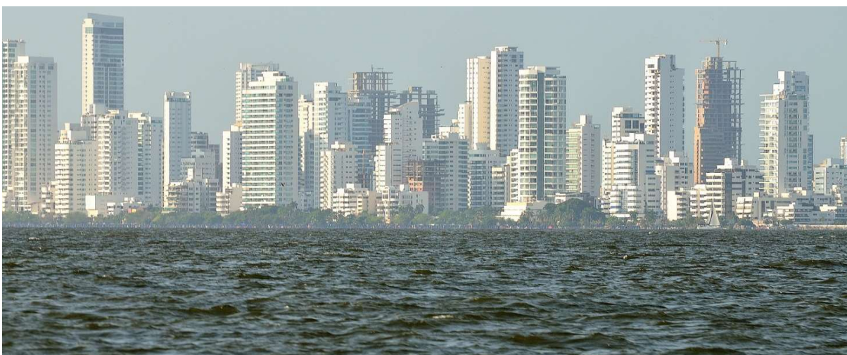
Imagen 3 Perfil de Bocagrande, Cartagena moderna y genérica.