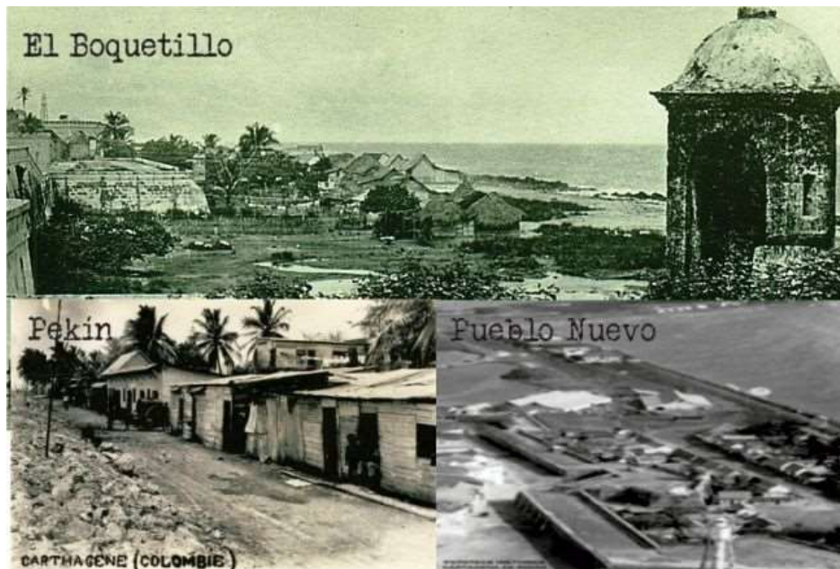
Imagen 1 Fotografías de los barrios desaparecidos de Pekin, Pueblo Nuevo y Boquetillo, los primeros barrios afro de la ciudad.

Andian, las cuales dan inicio a un periodo de expansión, “modernización” e higienización; o sea, la institucionalización de los órganos y entidades que decidirán sobre la ciudad, disputarán intereses y espacios. Decurrente de esto, se da la expansión de la ciudad por categorías: la construcción de los barrio de funcionarios altos de Bocagrande y la Manga sobre el litoral, la urbanización hacia el interior acompañando la ferrovía para los obreros, la erradicación “tugurios” y realojamiento de las comunidades afro en la zona marginal del litoral nororiente; y con la incipiente actividad turística de cruceros, se crean la Sociedad de las Mejoras públicas y la Junta Central de Monumentos Históricos y Turísticos (1932) y la declaración como “Centro turístico Nacional” por parte del gobierno nacional en 1943. (Redondo, 2004, págs. 63-66) (Stolker, 2017, págs. 11-15)