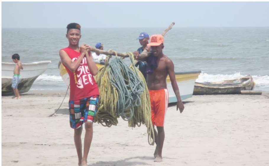
Imagen 7 Pesqueros artesanales en las playas de La Boquilla.

Lo problemático no solo es la naturaleza y los actores detrás de este proyecto 13 , sino la comunidad donde se asienta: afrocartageneros tradicionalmente pesqueros, con un histórico abandono por parte del Estado y ahora se verán expulsos o subempleados en la construcción y servicio de tales condominios. (Imagen 7)