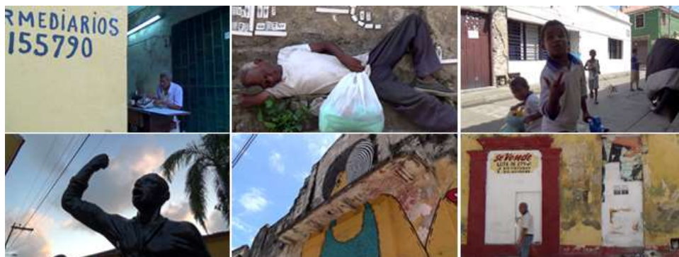
Imagen 14 Registros fotográficos parte de los cortos "Puntos de Fuga" que retratan la lucha contra la turistización el Getsemani, Cartagena de Indias.

La alternativa propuesta, es la patrimonialización de sus casas, estableciendo así una normativa que no permite la compra/venta de los inmuebles y que los exenta de pago de impuestos prediales, y abarata los cobros por servicios públicos; así mismo proponen que el Distrito y la Cámara de Comercio de Cartagena concedan créditos y recursos suficientes para ellos emprender como ofertantes de alojamientos y servicios turísticos, dándoles la autonomía de desarrollar en el barrio la actividad (y con libre elección) de la manera que hallen propicia y se adapte a sus costumbres y culturas, y dejando los residuales económicos directamente a ellos. (Imagen 14) (LeftandHandRotation, 2017)