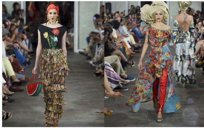
Imagen 12 Desfile de Modas de la colección 2017 "Las palenqueras" del diseñador Hernán Zajar.

El turismo también ha traído consigo su modalidad de turismo sexual, que es bastante fuerte en a la ciudad y que tiene como sus principales víctimas niñas y mujeres negras, algunas secuestradas y explotadas, otras por la falta de oportunidades reales de ejercer en otra actividad económica. Como sea, este tipo de turismo se diversifica en los cuerpos que ofrece (las jerarquías de colores según el público/costo), en los locales y en los valores. Ya sea en fiestas privadas sobre yates que en aguas internacionales se ofertan días de “sexo y droga sin límites” por millones de pesos (Imagen 11), o bajo la penumbra de las luces de la plaza de la Aduana en el centro histórico, donde niñas y mujeres son ofertadas a los turistas por proxenetas en complicidad con la policía local. (Imagen 12)