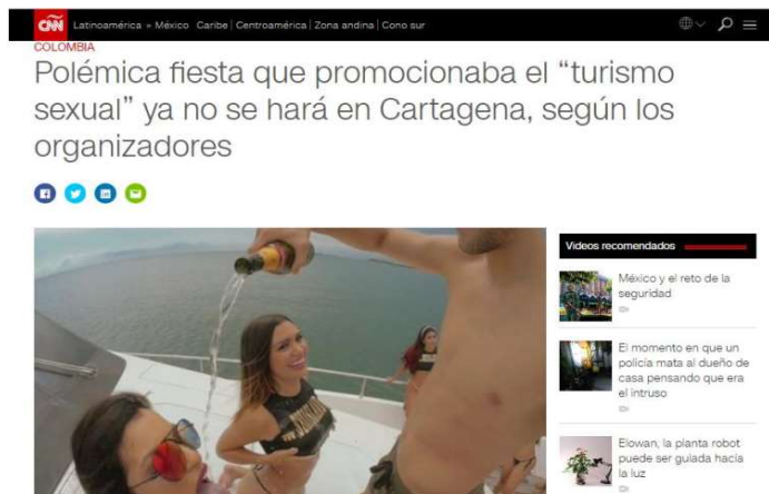
Imagen 11 Titular CNN donde se anuncia la fiesta de sexos, drogas, mujeres y armas sin límites

El turismo también ha traído consigo su modalidad de turismo sexual, que es bastante fuerte en a la ciudad y que tiene como sus principales víctimas niñas y mujeres negras, algunas secuestradas y explotadas, otras por la falta de oportunidades reales de ejercer en otra actividad económica. Como sea, este tipo de turismo se diversifica en los cuerpos que ofrece (las jerarquías de colores según el público/costo), en los locales y en los valores. Ya sea en fiestas privadas sobre yates que en aguas internacionales se ofertan días de “sexo y droga sin límites” por millones de pesos (Imagen 11), o bajo la penumbra de las luces de la plaza de la Aduana en el centro histórico, donde niñas y mujeres son ofertadas a los turistas por proxenetas en complicidad con la policía local. (Imagen 12)