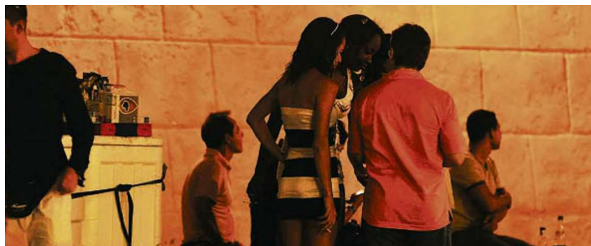
Imagen 10 Fotografía que retrata una escena de busca de trabajo sexual en el centro de Cartagena.