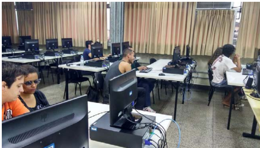
Figura 01 – Oficina “Treinamento no Uso do Leitor de Tela NVDA”

Na Figura 2 é mostrada uma representação tátil produzida com uma impressora de relevos para uso no treinamento. Essa representação tátil (em primeiro plano) foi utilizada para explicar a tela inicial clássica do Windows e a lista de ícones e atalhos.