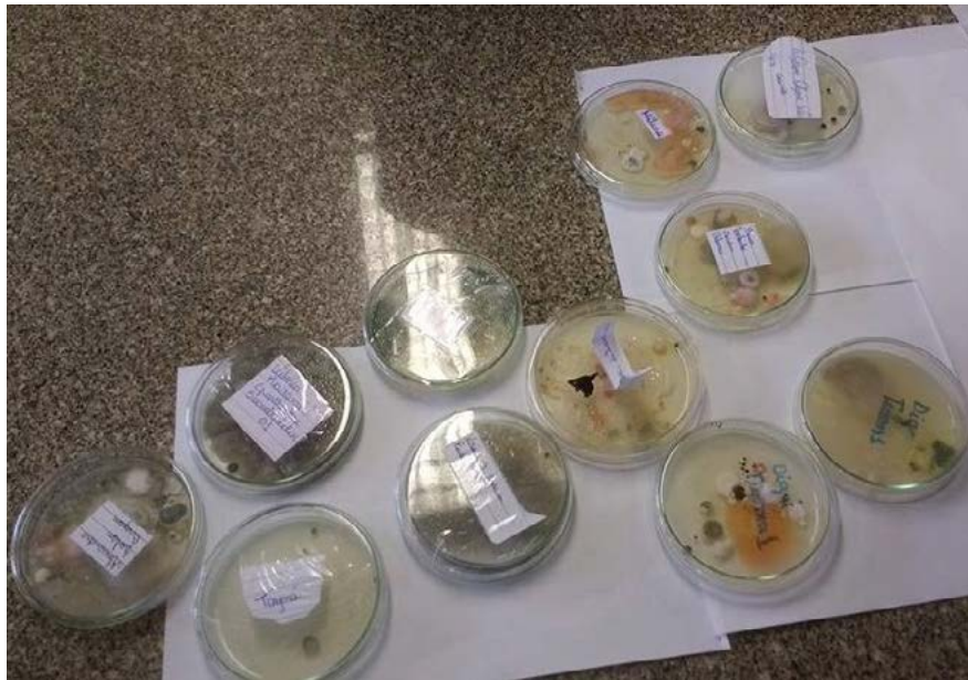
Figura 01 – Placas de petri contendo microrganismos coletados na escola.