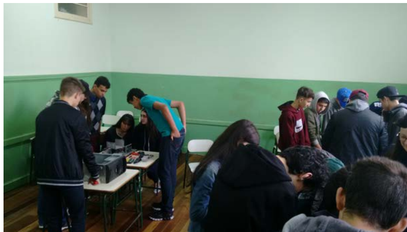
Figura 1. Oficina: Montando um Computador a partir do Lixo Eletrônico

Lixo Eletrônico, Montando um Computador a partir do Lixo Eletrônico (Figura 1) e Enigma: Montando um computador a partir do Lixo Eletrônico.