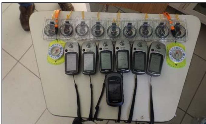
Figura 01 – Alguns equipamentos utilizados na prática

Durante as atividades os alunos utilizam bússolas, coletam pontos de interesse com o auxílio do receptor GPS, constroem bússolas artesanais e utilizando softwares desenvolvem e manipulam os mapas, aplicando conceitos de geografia e localização. Foram apresentadas aos alunos ferramentas utilizadas nas atividades práticas na área do Geoprocessamento, como os equipamentos e documentos cartográficos, GPS, nível laser, estereoscópio, teodolito, estação total, cartas