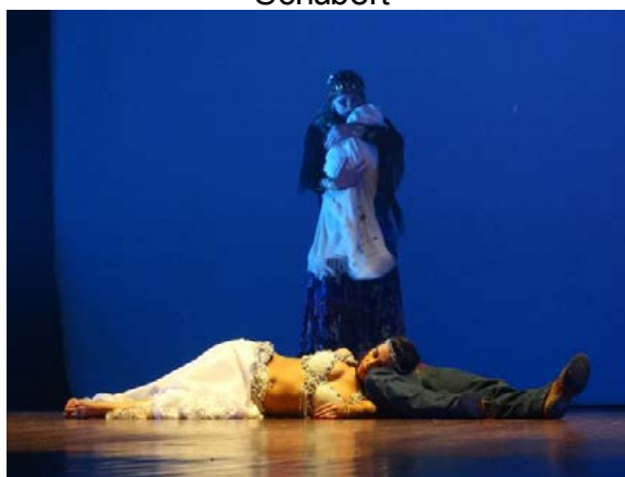
Figura 05 – Apresentação da Cia de Dança IFPR Schubert no espetáculo “Emociones Flamencas”, estreado em 30 de abril de 2016, no Centro Cultural Vera Schubert