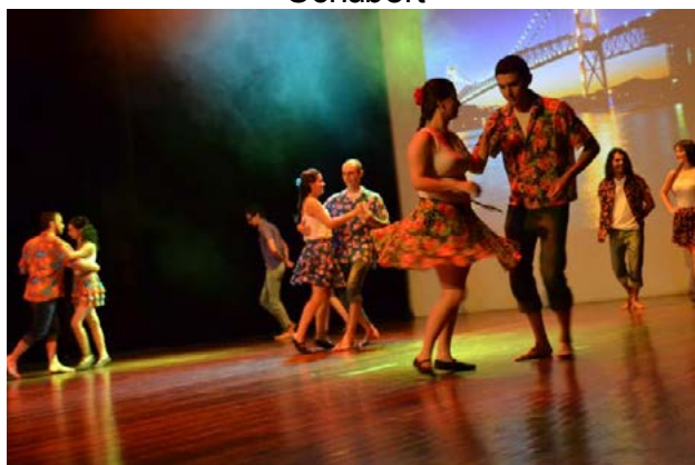
Figura 04 – Apresentação do grupo Área de Forró no espetáculo “Movimentando os Segredos da Alma”, estreado em 05 de dezembro de 2015, no Centro Cultural Vera Schubert