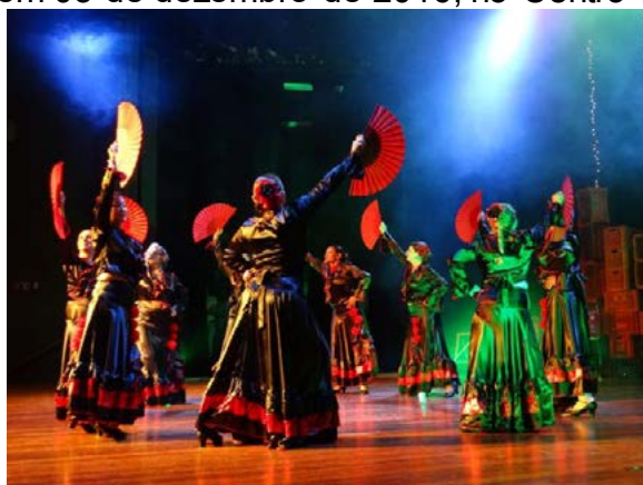
Figura 06 – Apresentação do grupo Arte Flamenca Senior no espetáculo “Hoje é Arte-feira”, estreado em 03 de dezembro de 2016, no Centro Cultural Vera Schubert