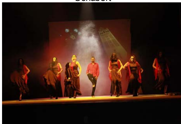
Figura 02 – Apresentação da Cia de Dança IFPR Schubert no espetáculo “Os Amores de Carmen”, estreado em 31 de maio de 2014 no Centro Cultural Vera Schubert