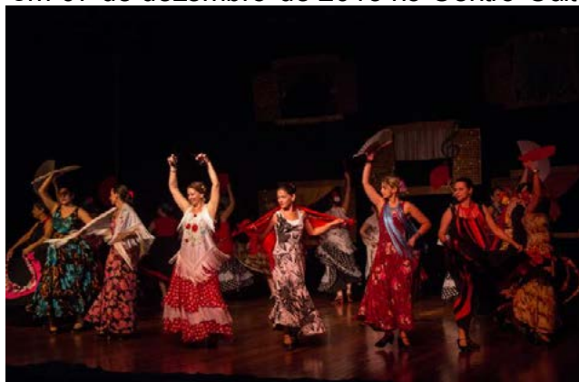
Figura 01 – Apresentação do grupo Arte Flamenca no espetáculo “Janelas para o Mundo”, estreado em 07 de dezembro de 2013 no Centro Cultural Vera Schubert

de Carmen” (2014), “Dance ou Estaremos Perdidos” (2014), “Movimentando os Segredos da Alma (2015), “Emociones Flamencas” (2016) e “Hoje é Arte-feira” (2016), mostrados nas Figuras 01, 02, 03, 04, 05 e 06.