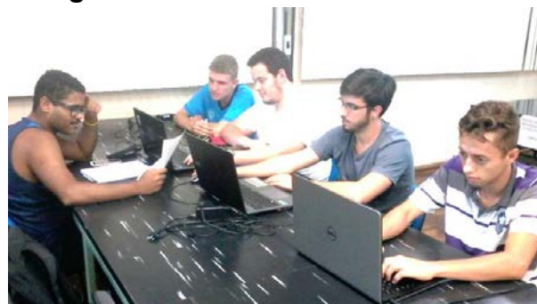
Figura 03 – Reunião entre bolsistas