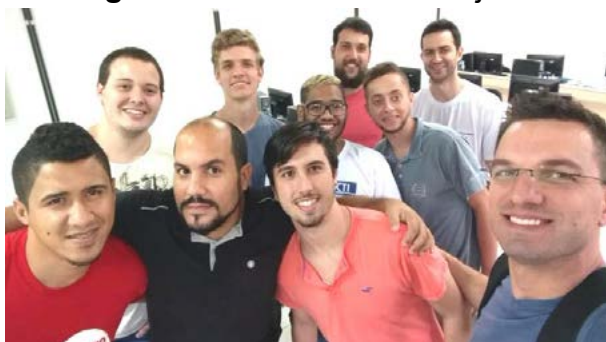
Figura 02 – Reunião do Projeto

As Figuras 02 a 11 a seguir mostram atividades práticas do projeto.