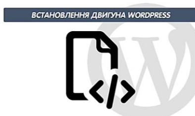
Рис. 4. УПОК 2 «Встановлення двигуна WORDPRESS»