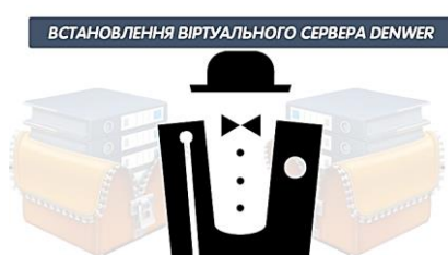
Рис. 3. УПОК 1 «Встановлення віртуального сервера Denwer»

Сайт має структурні підрозділи з тем: УПОК 1 «Встановлення віртуального сервера Denwer» (рис. 3); УПОК 2 «Встановлення двигуна WORDPRESS» (рис. 4); УПОК 3 «Встановлення шаблону» (рис. 5); УПОК 4 «Встановлення доповнень» (рис. 6); УПОК 5 «Візуалізація сайта» (рис. 7).