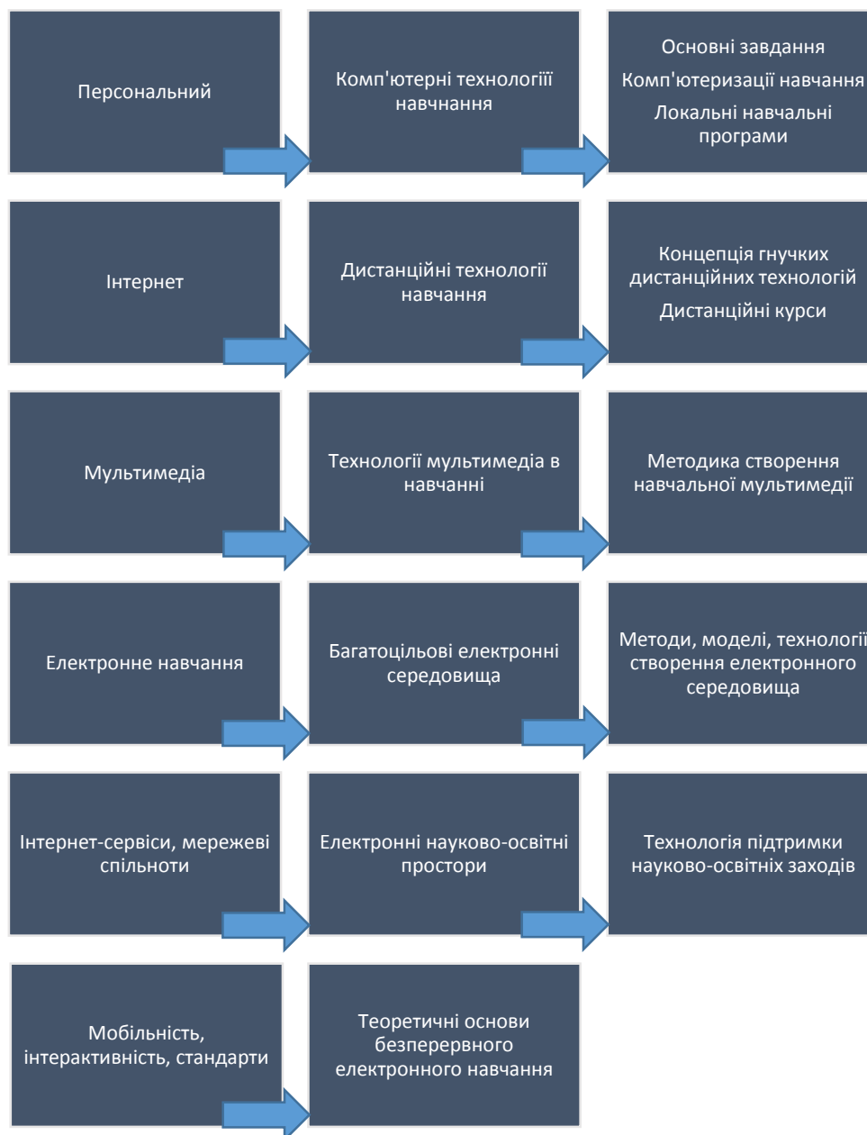
Рис. 1. Тематичні напрями досліджень і розробок ІКТ в Україні

З появою Інтернету і в процесі розвитку його сервісів, проблема забезпечення масового доступу до освіти набула нових рис. Незважаючи на те, що основою численності поки що залишаються універсальні рішення, основний акцент зміщується від масового впровадження локальних продуктів до створення перспективних розподілених рішень, умов для взаємодії продуктів, надання навчальних послуг. Саме ці умови, на нашу думку, є головною особливістю сучасного підходу для забезпечення інклюзії в вищій освіті. Це перехід до мережевої моделі обміну контентом і надання навчальних послуг, в рамках якого відбувається: