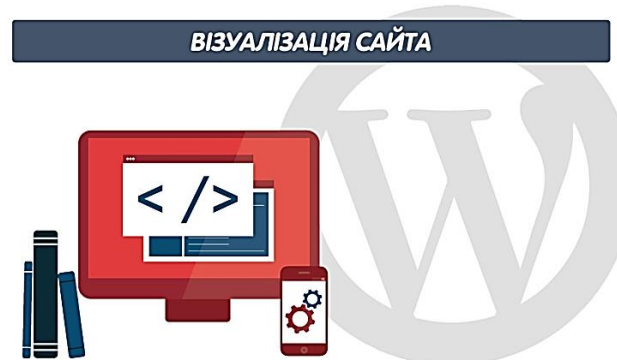
Рис. 7. УПОК 5 «Візуалізація сайта»

Кожна тема повністю розкривається методично, має аудіо супровід, відео матеріал, та надає часткову змогу «DAISY» формату. Використовуючи різні програвачі можна зупинити, або прослухати декілька разів запис, що покращить якість засвоєння знань. Відео-урок має невеликий розмір, що не дає змоги втомлюватися, а авторський дизайн кожної теми відтворює комфорт та легкість в отриманні нової інформації для студентів з вадами зору. Не синтезований, а саме оригінальний голосовий авторський супровід налаштує на приємний «діалог» з комп'ютером.