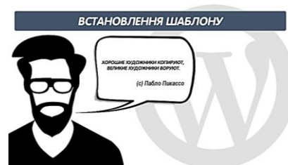
Рис. 5. УПОК 3 «Встановлення шаблону»