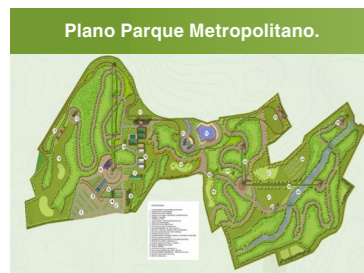
Fig. 12. Bodegas de almacenamiento y talleres.