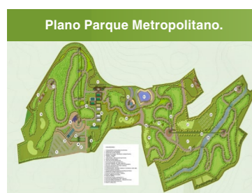
Fig. 13. Laguna artificial.

El interrogante planteado es la posibilidad de concebir y darle a ese espacio una utilidad que primero sea acorde a la naturaleza del sitio y segundo la idea de contribuir con una propuesta, carente no solo de un estándar como el anterior sino también de espacios lúdicos adecuados al volumen del área metropolitana.