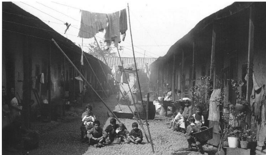
Imagen 3: Conventillo en Santiago hacia 1920