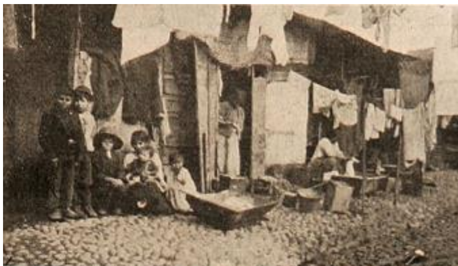
Imagen 1: Conventillo en Santiago en 1905