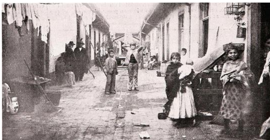
Imagen 2: Conventillo en Santiago en 1906