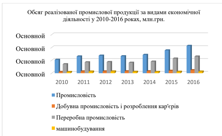
Рисунок 1. Обсяг реалізованої промислової продукції за видами економічної діяльності за 2010-2016 роки

Слід зазначити, що обсяги виробництва сектору машинобудування знаходяться на третьому місці після переробної та добувної галузей. (рис. 1)