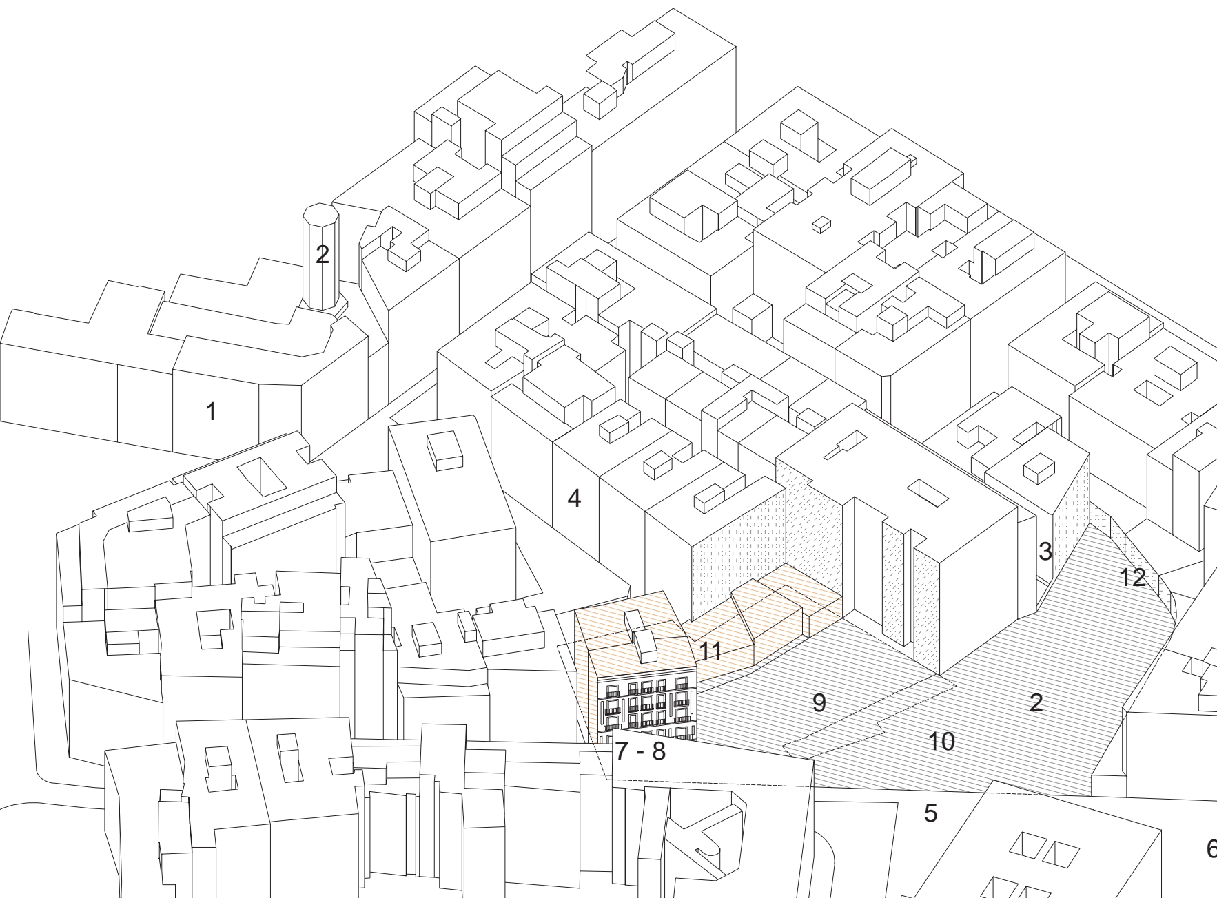
Perspectiva del solar i la seva "no-relació" amb l'entorn