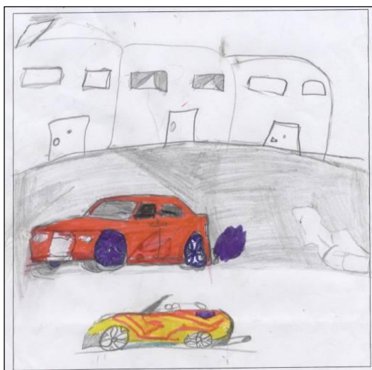
Figura 1: o meu bairro

De igual modo, a frequência de certas atividades ilegais, como as corridas de automóveis e a condução perigosa, a par da regularidade como que se veem abandonados nas ruas dos bairros, leva à consideração de uma facilidade de acesso à delinquência “rodoviária”.