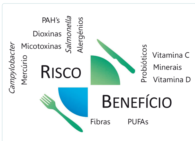
Figura 1: Avaliação de risco-benefício de alimentos.

Apesar da evolução a nível internacional verificada nos últimos anos no domínio da avaliação de RBA, através do desenvolvimento de diferentes projetos (2-8) , redes e iniciativas (9) , existem diversos desafios no desenvolvimento da avaliação de RBA (10) , entre os quais se destacam a ausência de dados e de conhecimento nas diferentes áreas que a integram, a não inclusão da componente microbiológica nestas avaliações e a não utilização de métricas integrativas de saúde.