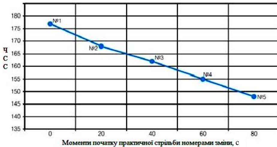
Рис. 2. Динаміка ЧСС під час виконання практичних стрільб з пістолета “Форт-12” через 20 с інтервалу відпочинку після комбінованого фізичного навантаження