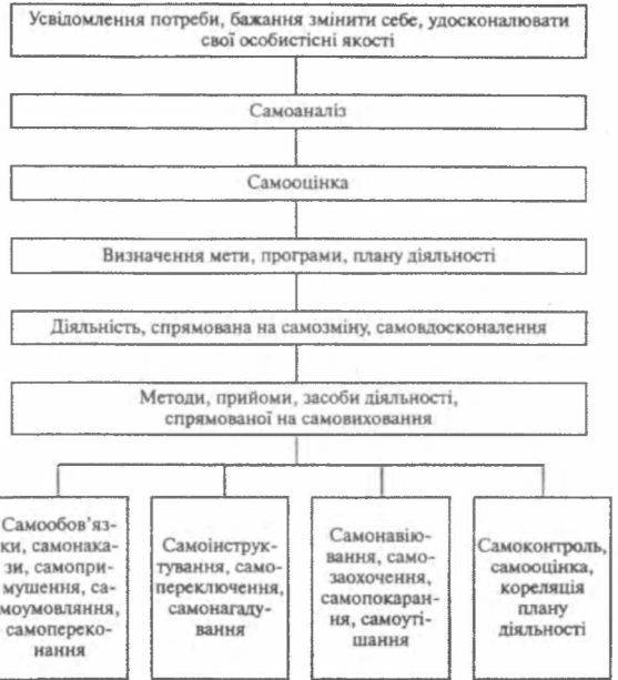
Рис. 3. Структура процесу самовиховання