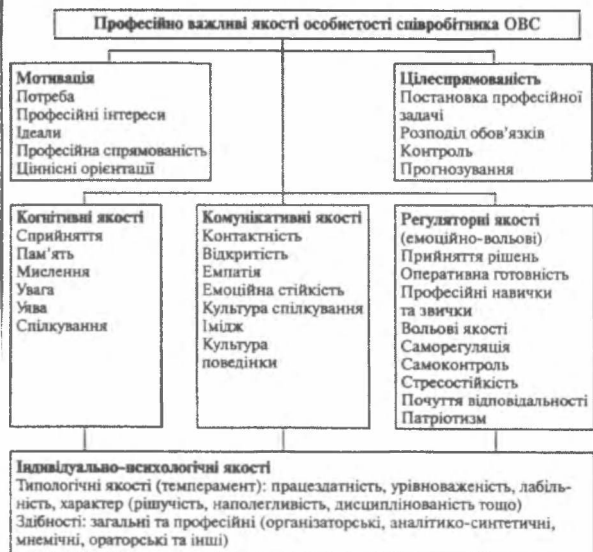
Рис. 1. Модель (схема) професійно важливих якостей особистості працівника ОВС