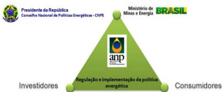
Figura 1. Inserção da ANP no quadro regulatório brasileiro

Como se nota, a função normativa é utilizada por diversos órgãos com variações de alcance. Essa distinção veio para sedimentar a estrutura de um mercado específico que necessitava de maior competitividade no mercado internacional petrolífero.