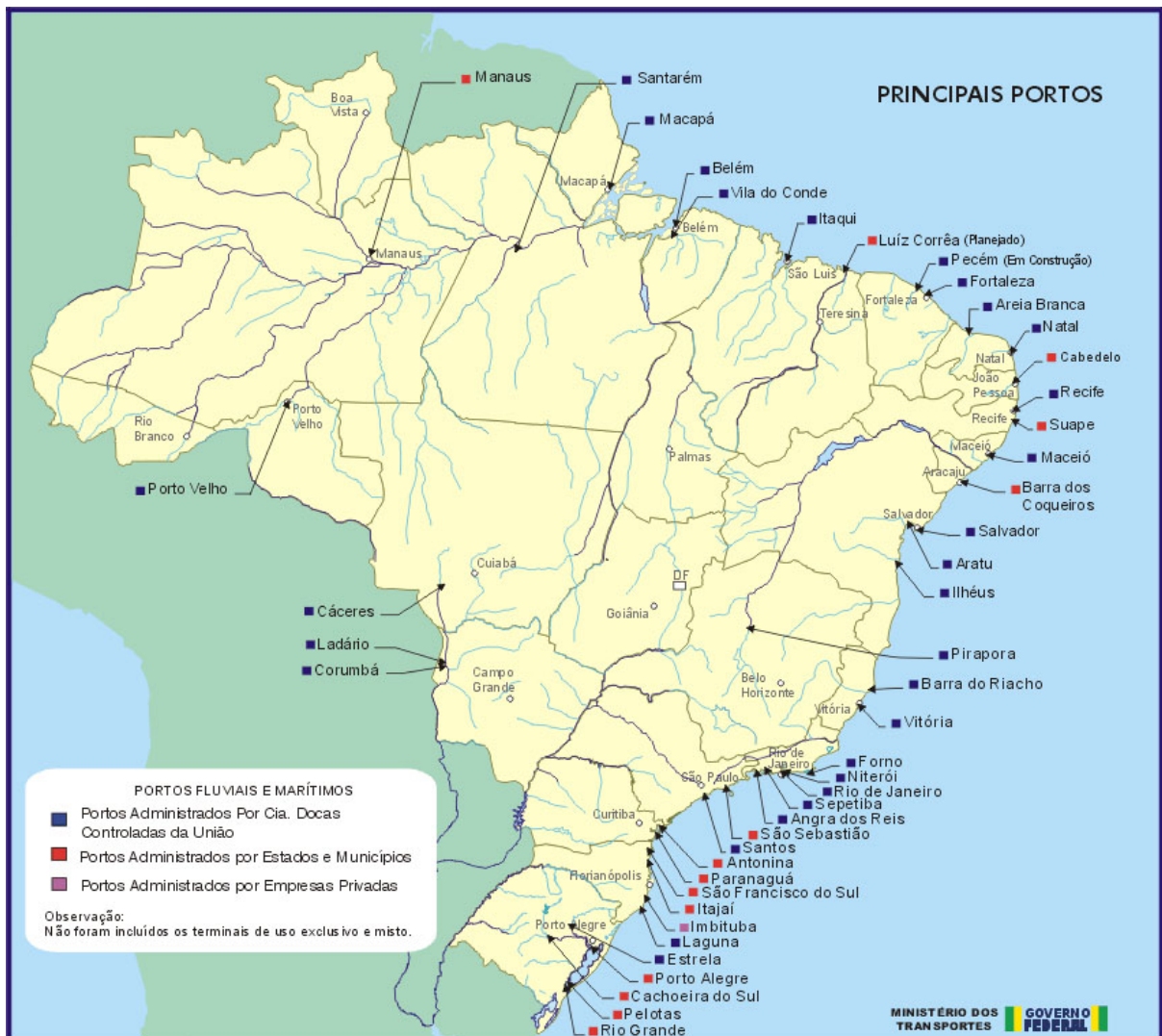
FIGURA 01: Mapa dos Principais Portos Marítimos Brasileiros