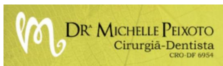
FIGURA 08 – LOGOMARCA DO CONSULTÓRIO ODONTOLÓGICO