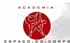
FIGURA 09 – LOGOMARCA DA ACADEMIA ESPAÇO DO CORPO

A rede de academias Espaço do Corpo é constituída por três academias, sendo duas na cidade do Cruzeiro e uma no Guará II. A academia do Guará é a mais nova, criada há pouco mais de um ano. Inicialmente a academia do Guará teria o nome de Panorâmica, pelo fato de ser aberta 360º, sem paredes fechando os lados. Mas, como foi feita uma sociedade entre o dono das academias já existentes no Cruzeiro e o dono da academia que seria fundada no Guará, a opção foi de manter o mesmo nome, por ser um nome que já tinha referências no mercado. Porém, com a inauguração da nova academia, mudou-se a marca e o conceito de cores e anúncios.