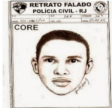
FIGURA 5- Monstro do Morumbi