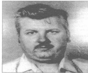
John Wayne Gacy Executado em 1984 — Illinois Cara de empresário, alma de assassino