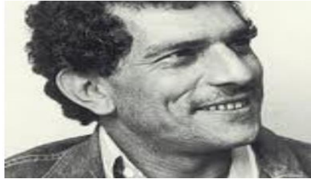
FIGURA 4- Chico Picadinho