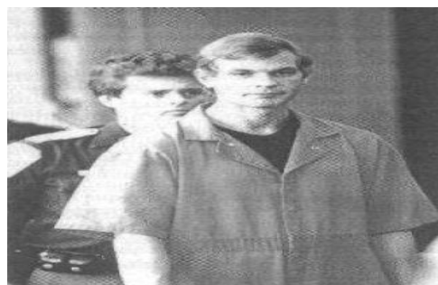
FIGURA 2- Jeffrey Lionel Dahmer

Fonte: CASOY, Ilana. Serial killer: louco ou cruel? . 6. ed. São Paulo: Madras, 2004. p.142