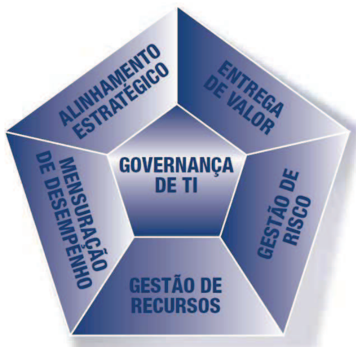
Figura 1 - Áreas de Foco na Governança de TI

Neste trabalho será abordado o foco de Gestão de Recursos. O COBIT 4.1 explica a Gestão de Recursos num contexto em que a organização de TI entrega de acordo com esses objetivos, baseado num conjunto claramente definido de processos que usam a experiência das pessoas e a infraestrutura tecnológica para processar aplicativos de negócios de maneira automatizada, aprimorando as informações de negócios. Esses recursos em conjunto com os processos constituem a arquitetura de TI da organização. Para atender aos requisitos de negócios para TI, a organização precisa investir nos recursos necessários para criar uma adequada capacidade técnica que atenda a uma necessidade de negócios, resultando no desejado retorno (ITGI, 2007).