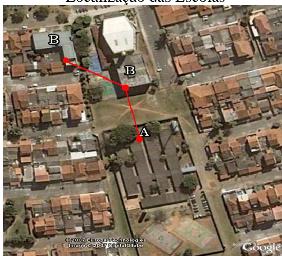
Figura 1 Localização das Escolas