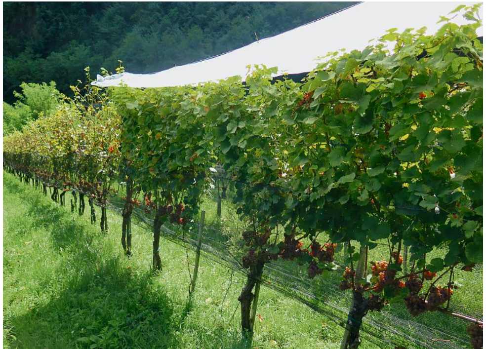
Abb. 2: Gewürztraminer-Rebanlage unter Regenabdeckung und die Kontrollanlage am Versuchszentrum Laimburg

Auf diese Weise können die Forscher feststellen, wie viel Stickstoff freigesetzt wird, wie schnell der Mineralisierungsspitzenwert erreicht wird und wie sich die mikrobielle Biomasse je nach verwendeten Düngern verhält. Sollte ein Produkt eine nennenswerte Menge mineralischen Stickstoffs ( \text{NO}_3 oder \text{NH}_4 ) freisetzen, die aber von Bakterien immobilisiert wird, tritt im Boden ein erheblicher Mangel auf, der manchmal sogar höher als im nicht gedüngten Boden ausfällt. Die Mengen an mineralisiertem, immobilisiertem und organischem Stickstoff, die am Ende der Untersuchung vorhanden sind, sollen dabei helfen die Menge einzuschätzen, die sich als \text{N}_2\text{O} in die Atmosphäre verflüchtigt hat. Beim Distickstoffdioxid handelt es sich um ein gefährliches für das Ozonloch mitverantwortliches Treibhausgas.