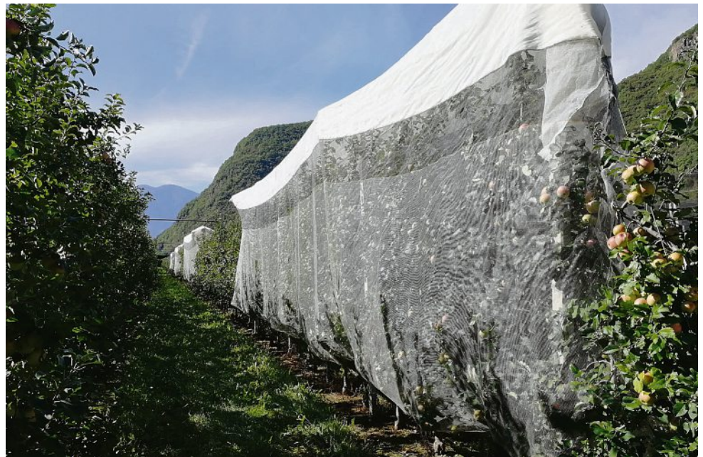
Abb. 1: Eine durch das Keep-in-Touch®-System geschützte Fuji-Anlage (rechts) und die Kontrollanlage (links) am Versuchszentrum Laimburg

Zunächst machen die Forschungseinrichtungen lokal erhältliche Produkte ausfindig. Im Idealfall sind dies abfallende Produkte aus der landwirtschaftlichen oder industriellen Produktion, deren Stickstoffgehalt und deren Potenzial, dem Boden Nährstoffe (u. a. Stickstoff) zuzuführen, bewertet wird. Am Versuchszentrum Laimburg sind derzeit zwölf