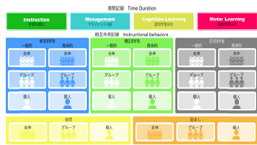
図3 初期バージョンの分析コードボタン配置

図3には初期の分析コードボタンの配置を示した。3.(2)で述べた2つの組織的観察法に対応する授業分析アプリ用の分析コードボタンを作成した。観察者がiPad画面上の分析コードボタンを押すことで、入力ができる、その結果は、その上のタイムラインの出力部に即座に反映されるように設計した。