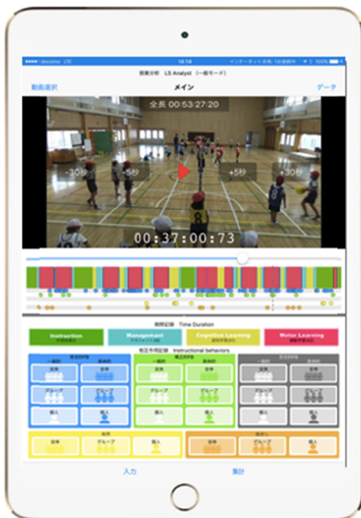
図2 iPadの初期画面構成

まず、上部には、撮影した動画取り込んだ場合に映像を再生するモニターを配した。映像なしで授業分析する場合には、その部分は黒色モニターとなり、経過時間の表示などの機能をもたせた。