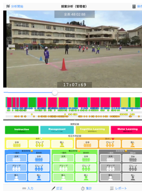
図5 最新版1.8.5の分析コードの画面

また実践現場での活用法としては、研究代表者が授業観察者となり、分析結果を映像データとともに授業後直ちにフィードバックする方法を用いた。その時間も約10分から30分程度と幅はあったが、観察者からの一方的な指摘だけではなく、映像と分析データを確認しながらの授業の省察は、授業者の実践的指導力を高めるのに効果的であった。そのことは、その授業の次の授業での組織的観察データで裏付けられた。例えば、期間記録のマネジメント時間や説明などの学習指導場面が短縮して、運動学習時間が50-60%は確保され、認知的学習の場面が効果的に配分されることで示された。また、相互作用記録からは、極端に肯定的FBが少なかった授業者が次の授業では100回を超える肯定的FBが寄せられるようになる、発問を有効に使って児童の思考や表現力を伸ばそうとするなどの行動に反映された。