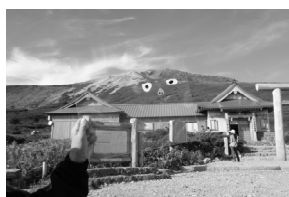
図4（右） 《白山ゴブリン》