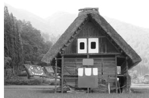
図2 「世界遺産アートプロジェクト 合掌ゴ布林をつくらう!!」、白川村合掌造り集落／岐阜県大野郡白川村、2015

これまでの活動数は、その規模の大きさを合わせると約160件で、実施都道府県・海外都市数としては1都1道2府15県2海外都市となる（2018年4月現在）。そして、その実施施設・空間は大別すると、「地域施設・空間」「学校施設」「複合商業施設」「芸術施設」「ケア施設」と分けられる。