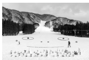
図3（左） 全体＝《ゲレンデゴブリン》、手前＝《雪像ゴブリン》