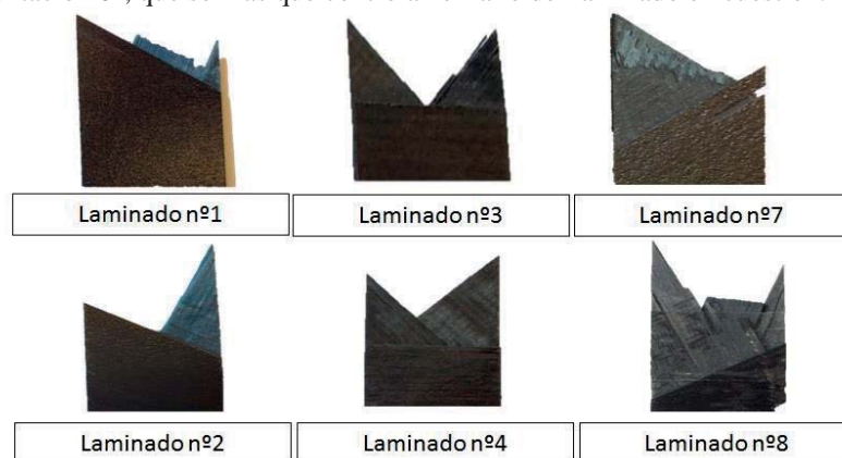
Fig. 1. Probetas ensayadas de los laminados nº1, nº2, nº3, nº4, nº7 y nº8

fibras en determinadas láminas mientras que con n=3 sólo tiene lugar el fallo de la matriz en todas las láminas. En la Tabla 2 aparecen los resultados de parámetros experimentales, módulo de Young ( E_x ), tensión ( \sigma_R ) y deformación de rotura ( \epsilon_R ), valores medios con sus respectivas desviaciones típicas. En ellos puede apreciarse que en laminados con n=1 la rotura tiene lugar a una carga y deformación mayor que con n=3 . Esto puede deberse a que en los laminados con n=1 , todas láminas adyacentes a una cualquiera tienen una orientación distinta y se produce una mayor interacción entre ellas, inhibiéndose (retrasándose) la aparición del fallo. Esto ocurre en todos los laminados menos en el caso de los laminados nº5 y nº6, donde la diferencia es menos significativa. Esto es debido a que dichos laminados incluyen (son los únicos) láminas con orientación 0^\circ , que son las que controlan el fallo del laminado en cuestión.