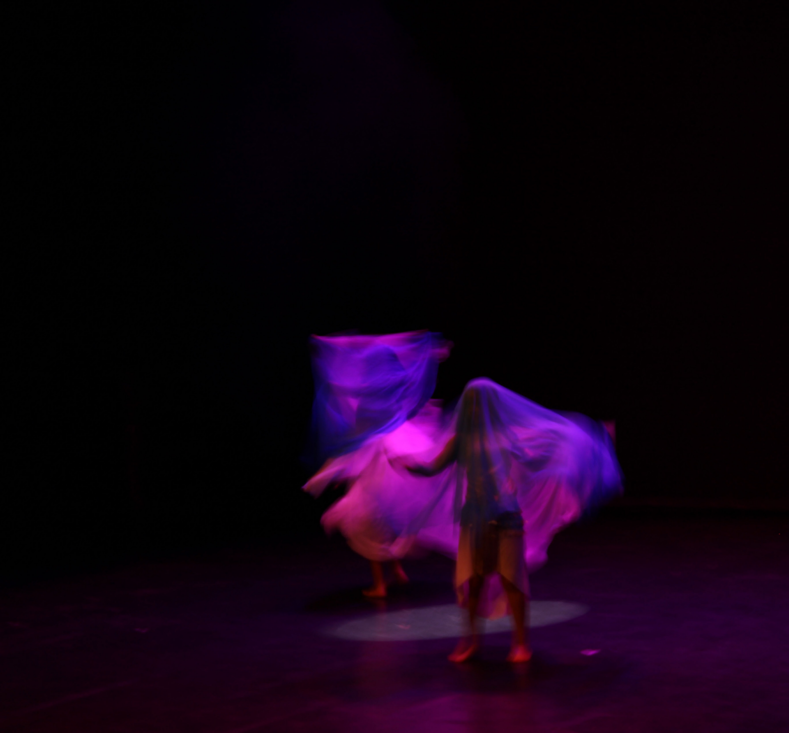
Moving Lights (Luces en movimiento) 3: Ghost María José Cambero Cambero Fotografía digital 3762 × 3162 ppp