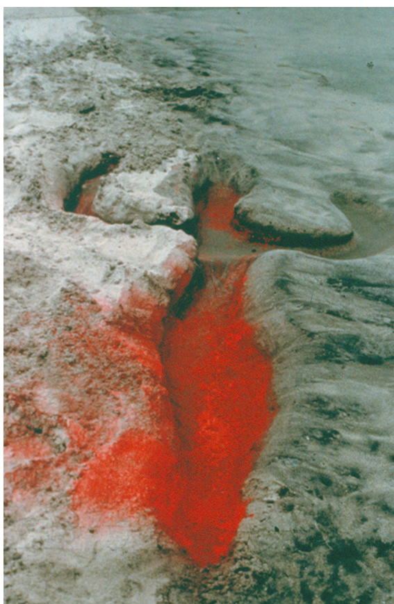
FIGURA 7. Ana Mendieta, Big Gulp , 2009. Disruption, Sara Hilden, Art Museum, Tampere, 2015, Finland.

del desnudo y el cuerpo femenino. Emplea vestimentas que refuerzan la idea de vulnerabilidad del cuerpo, la puesta en escena va más allá, siendo más conceptual. Se la relacionada con frecuencia a la publicidad y la moda, sus obras utilizan el cuerpo como un material constructivo, alejado de cualquier intención sexual. Beecroft atiende el cuerpo como un soporte para su arte: << Sin embargo, no considero el cuerpo algo físico. El cuerpo está para expresar el pensamiento intelectual, las emociones y las soluciones formales. >> 15