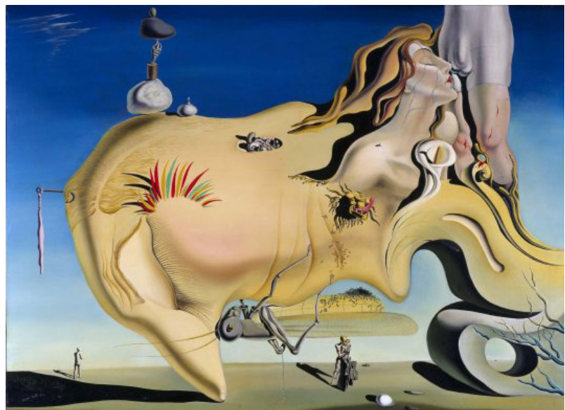
FIGURA 4. Salvador Dalí, El Gran Masturbador , 1929. Museo Reina Sofía, Madrid, España.