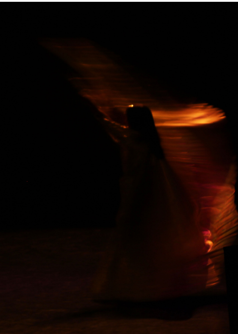
Moving Lights (Luces en movimiento) 8: Gold María José Cambero Cambero Fotografía digital 5184 × 3456 ppp