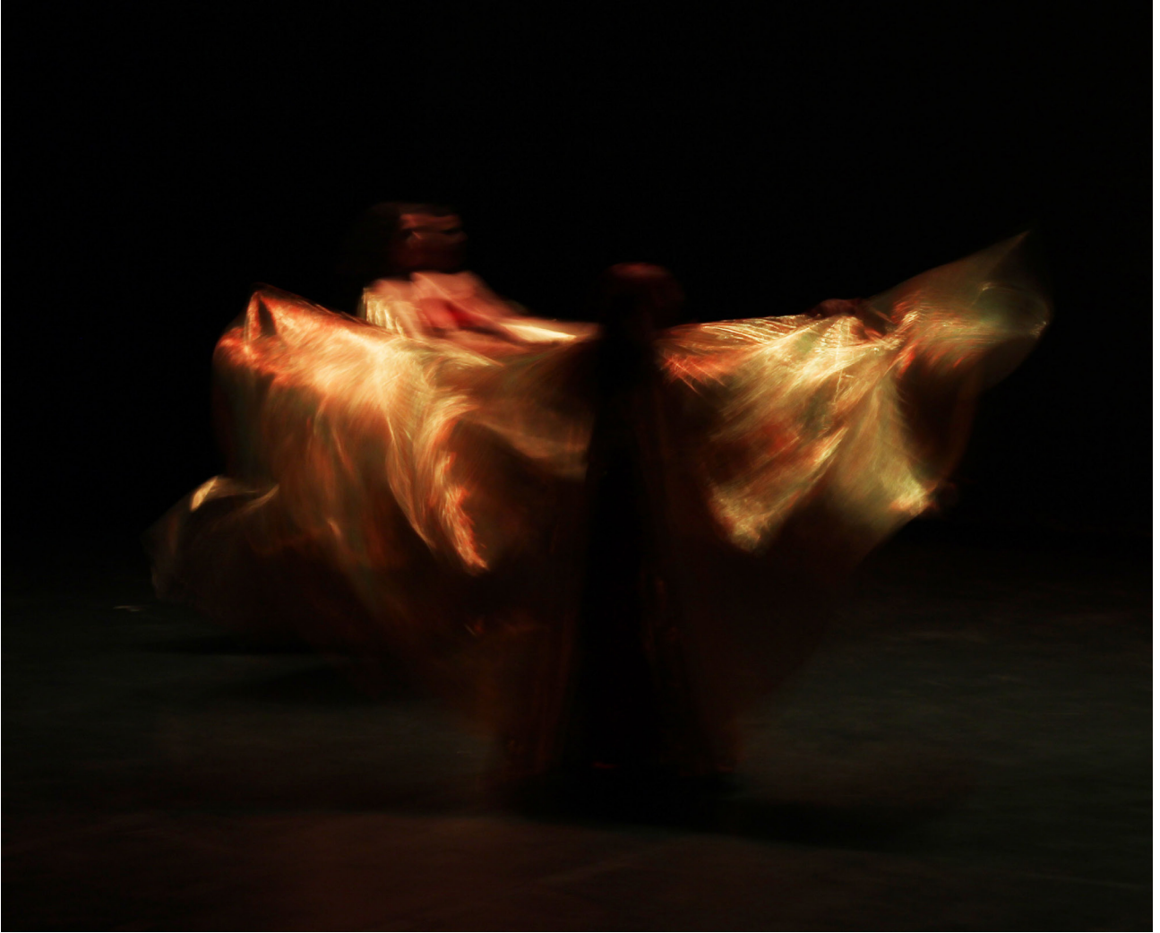
Moving Lights (Luces en movimiento) 4: Angel María José Cambero Cambero Fotografía digital 3108 × 2508 ppp