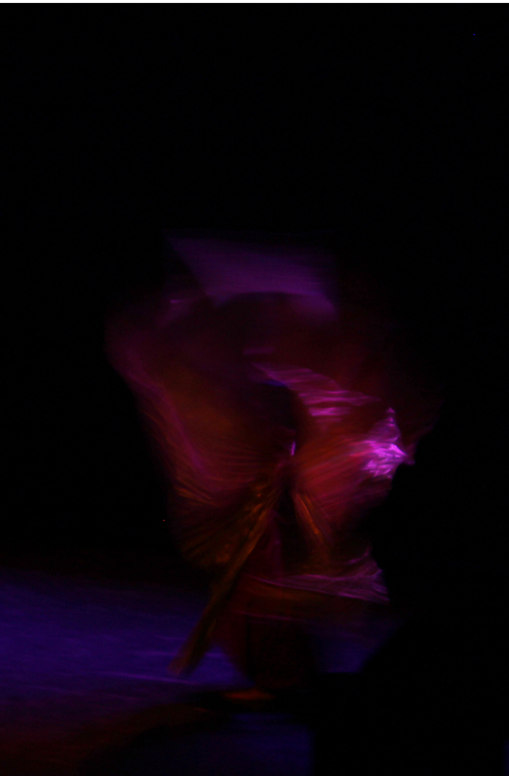
Moving Lights (Luces en movimiento) 6: Movement María José Cambero Cambero Fotografía digital 5184 × 3456 ppp