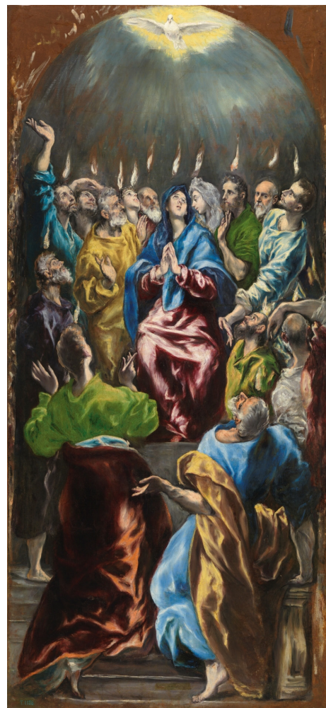
FIGURA 1. El Greco, Pentecostés , 1600. Museo del Prado, Madrid, España.

Tras cuestionarnos acerca del ser y el alma, surge una nueva cuestión: