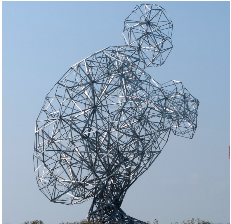
FIGURA 3. Antony Gormley, Exposuer , 2010. Lelystad, Países Bajos.

6 Pielas (2017). [Película]. Película dirigida por Eduardo Casanova. España: Pokepsie Films, Nadie es perfecto y Netflix