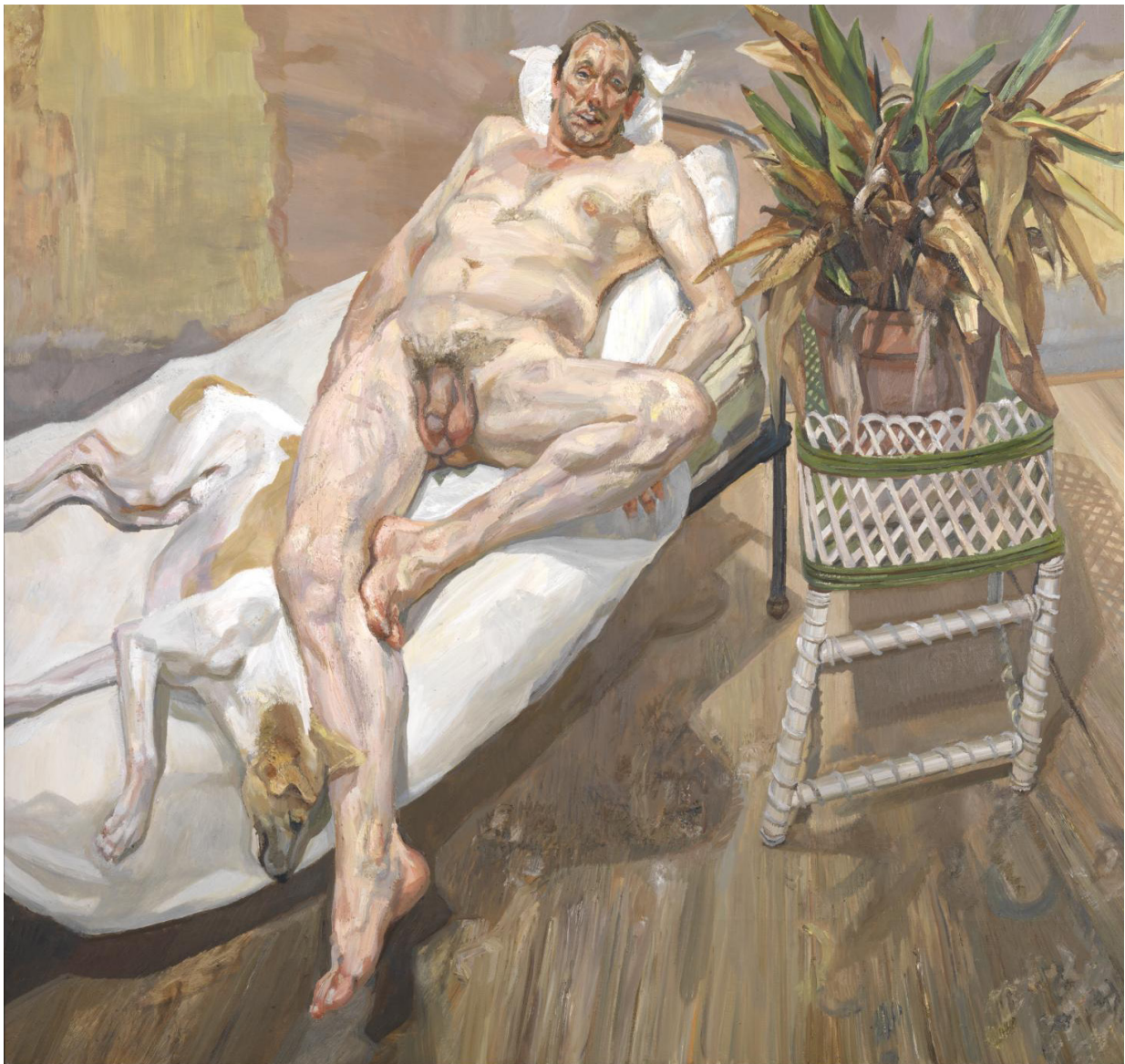
FIGURA 2. Lucian Freud, David and Eli , 2003. Tate Modern, Londres, Reino Unido.

<<Conócete a ti mismo>> (Sócrates, 470 a.C.- 399 a.C.), es una tarea esencial que todo ser humano debe hacer para intentar guiar su vida y situarse en el mundo.