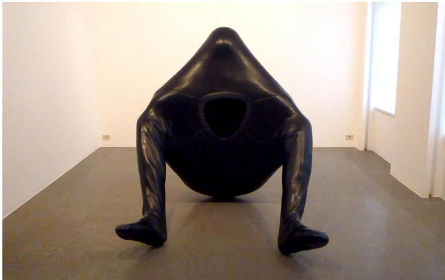
FIGURA 6. Erwin Wurm, Big Gulp , 2009. Disruption, Sara Hilden, Art Museum, Tampere, 2015, Finland.

El sujeto que habita el cuerpo, el “yo” ha sido disuelto y omitido, transformado en un cuerpo posthumano, echo papilla por las imágenes, se ha convertido en objeto de contemplación buscando el deseo, aceptación y envidia de los demás, de este modo ha surgido el cuerpo proteico, lleno de modificaciones corporales. El arte afronta este cuerpo