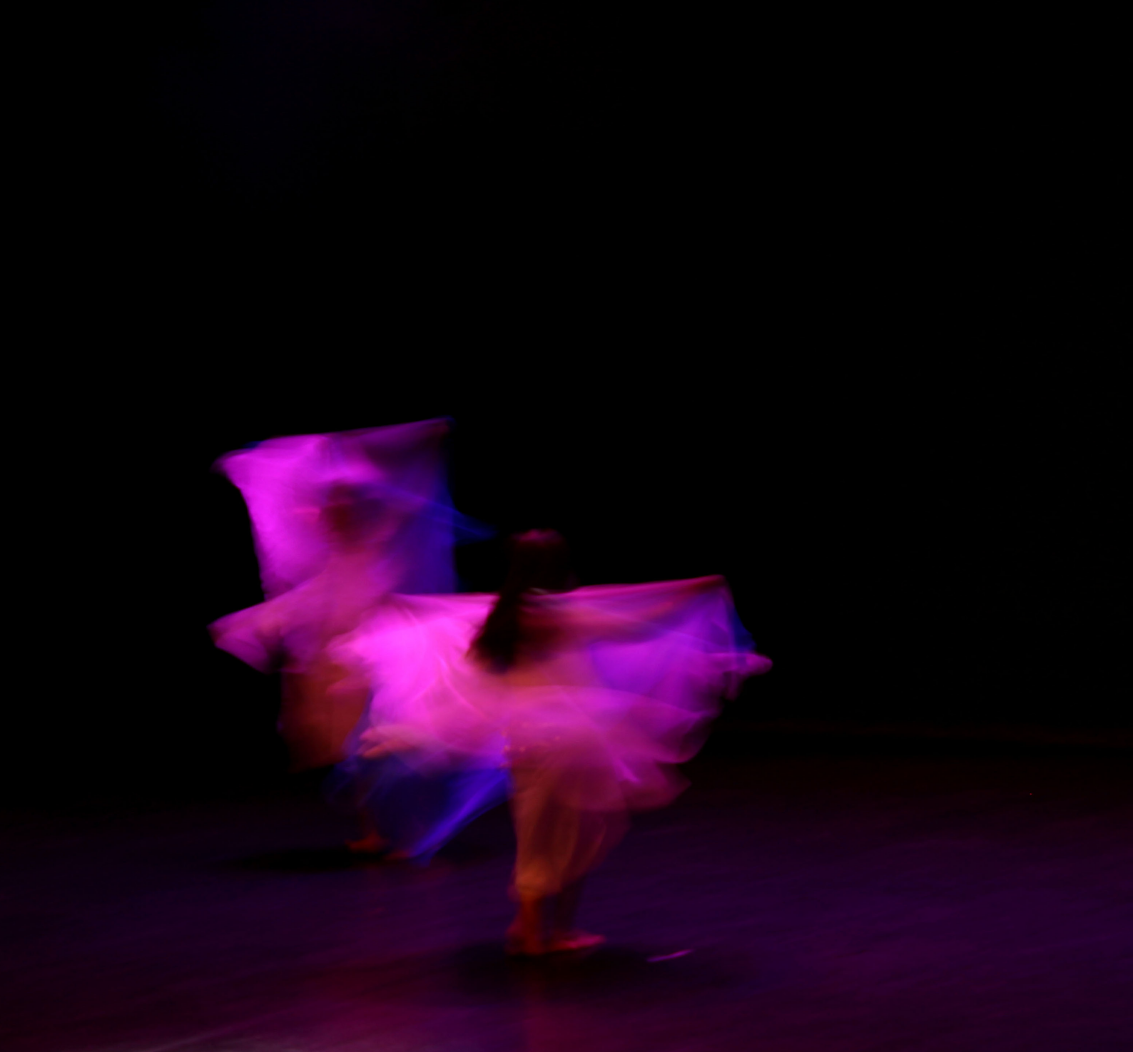
Moving Lights (Luces en movimiento) 2: Veil María José Cambero Cambero Fotografía digital 3166 × 3029 ppp