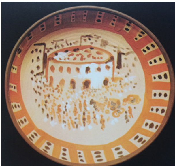
Figura 3. Pablo Picasso, Corrida , 1953, plato redondo de cerámica, Musée d'Art Moderne, Céret.