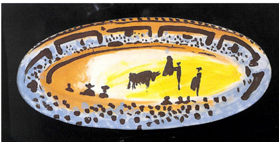
Figura 8. Pablo Picasso, Corrida , Vallauris, 1957, fuente ovalada de cerámica, Musée d'Art Moderne, Céret.