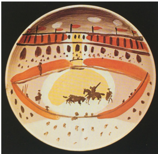
Figura 5. Pablo Picasso, Corrida , 1953, plato redondo de cerámica, Musée d'Art Moderne, Céret.