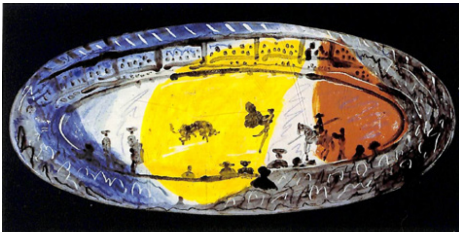
Figura 7. Pablo Picasso, Corrida , Vallauris, 1957, fuente ovalada de cerámica, Musée d'Art Moderne, Céret.