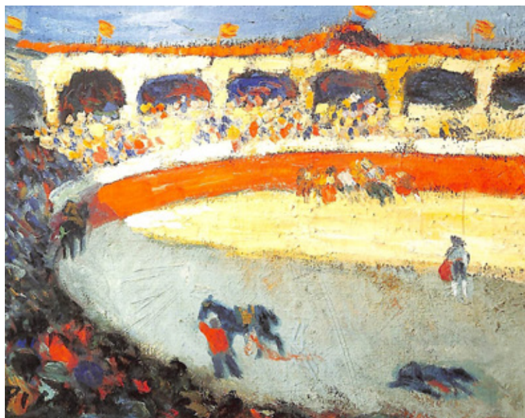
Figura 2. Pablo Picasso, Corrida de toros , 1901, óleo sobre lienzo, colección privada, Nueva York.