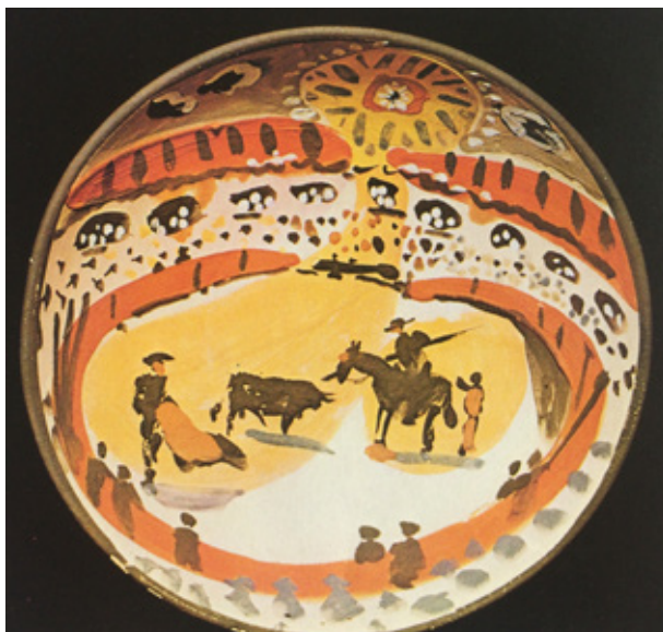
Figura 4. Pablo Picasso, Corrida , 1953, plato redondo de cerámica, Musée d'Art Moderne, Céret.