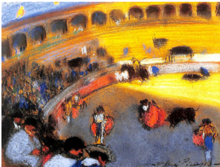
Figura 1. Pablo Picasso, La corrida , Barcelona, 1900, óleo sobre lienzo, colección privada, Barcelona.