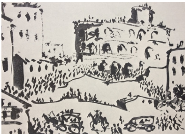
Figura 6. Pablo Picasso, A los toros , 1957, aguatinata sobre cobre, Tauromaquia de Pepe Illo.