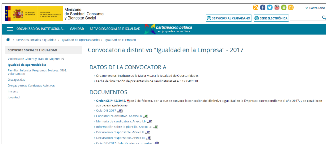
ILUSTRACIÓN 5: CAPTURA DE PANTALLA CONVOCATORIA DIE 2017