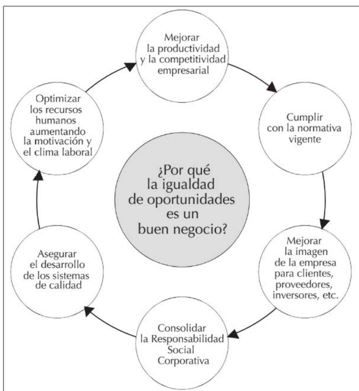
ILUSTRACIÓN 1: INTERACCIÓN ENTRE LOS ELEMENTOS QUE PROMUEVEN LA APLICACIÓN PARTICIPATIVA DEL PROGRAMA

FUENTE: Elaboración de D.T. Kahale Carrillo, en su libro “El distintivo empresarial en materia de igualdad” a partir del folleto “La igualdad entre mujeres y hombres en las empresas” del Ministerio de Sanidad, Política Social e Igualdad.